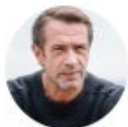
Владимир Львович Машков