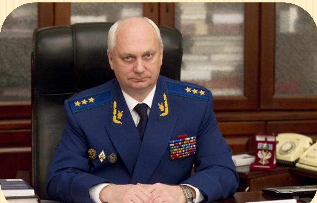
Фридинский Сергей Николаевич, Главный военный прокурор РФ.