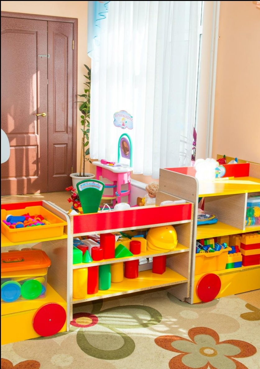
«Сенсорика – конструирование»