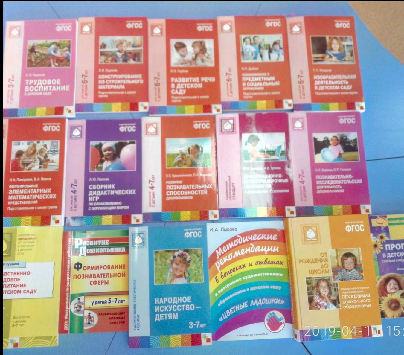
Методическая литература педагога