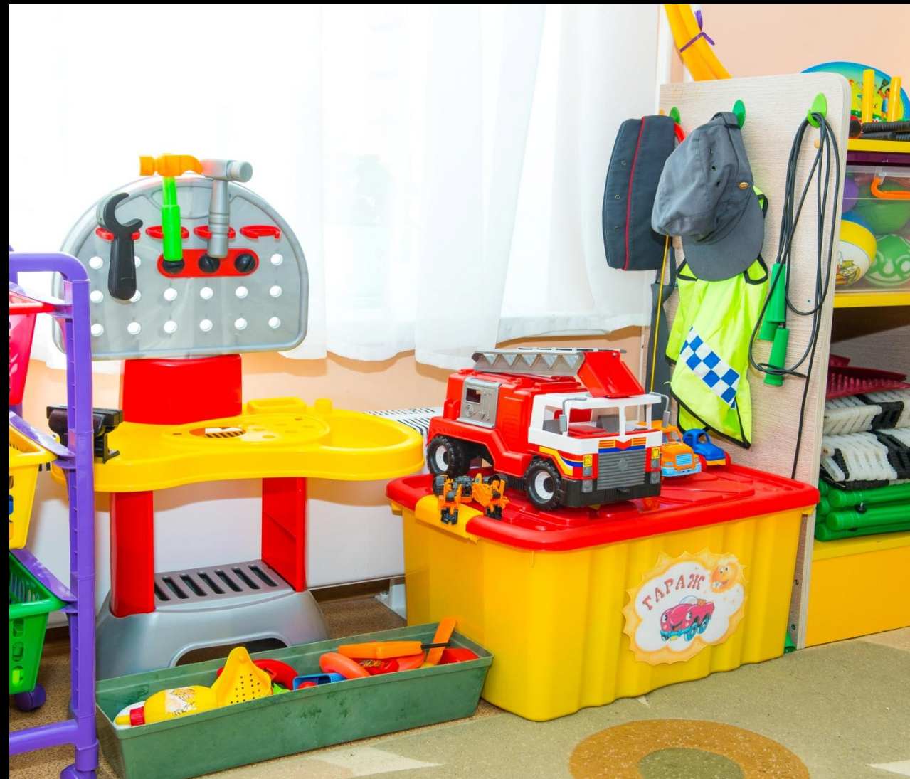
«Мастерская» «Дорожное движение»