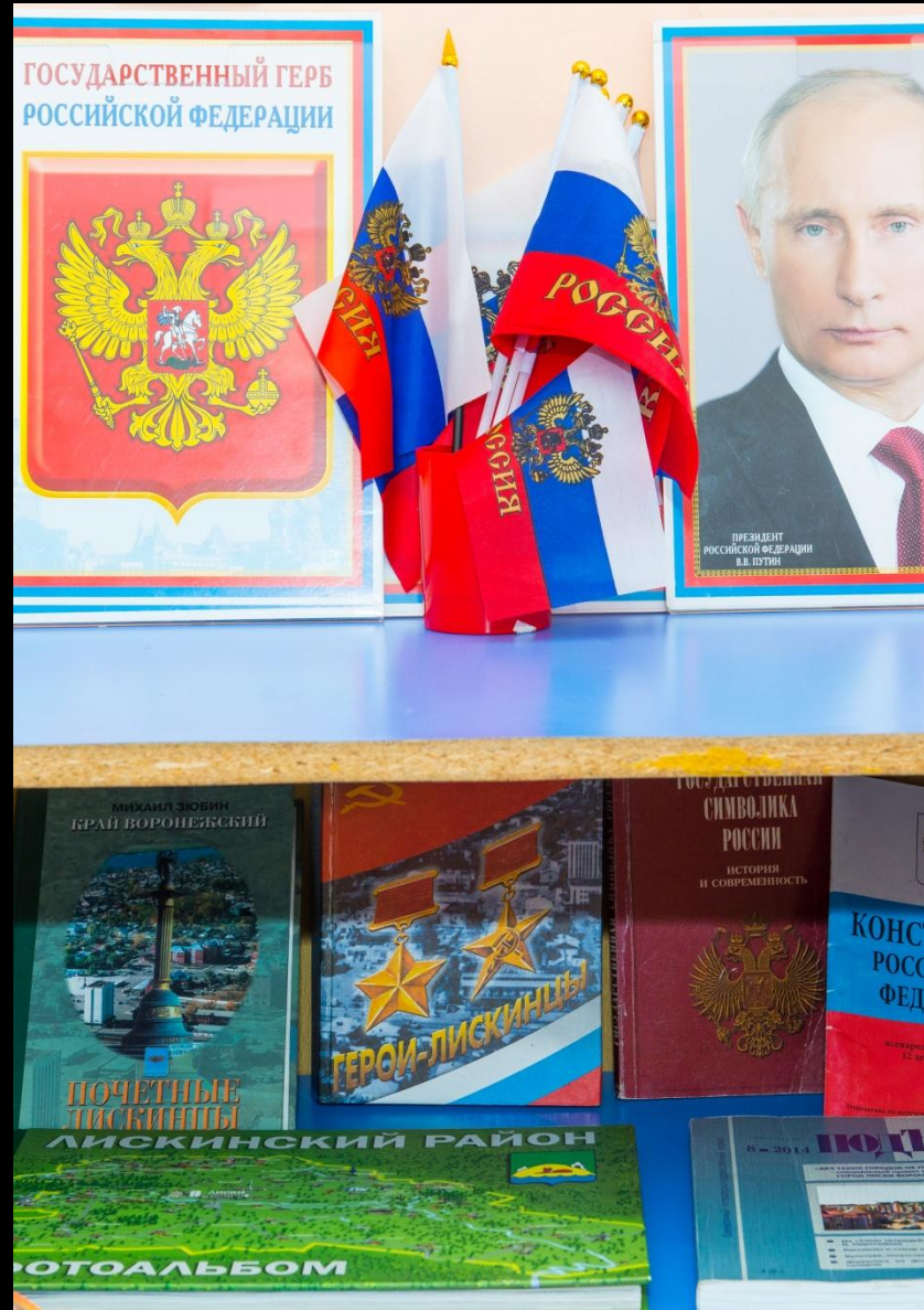
«Наследие культуры и социокультурные ценности»