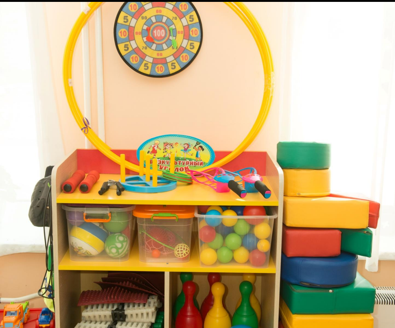
Физкультура и спорт