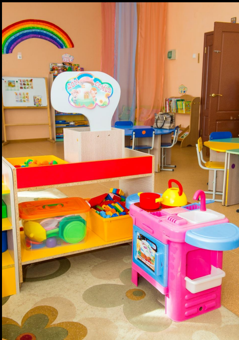
«Кухня» «Дом, семья»