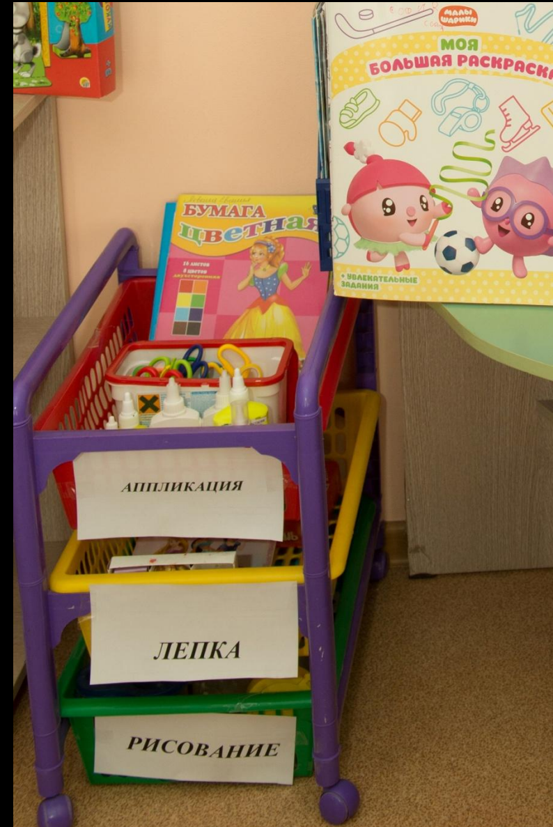
«Центр художественного творчества»