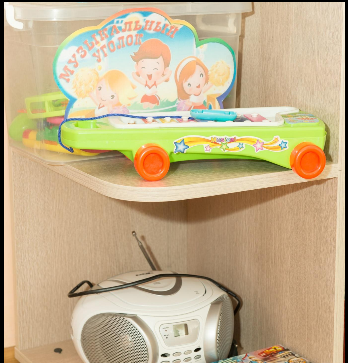
«Мир звуков и музыки»