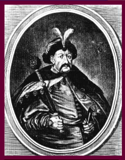
Гетман Украины Богдан Хмельницкий. Гравюра