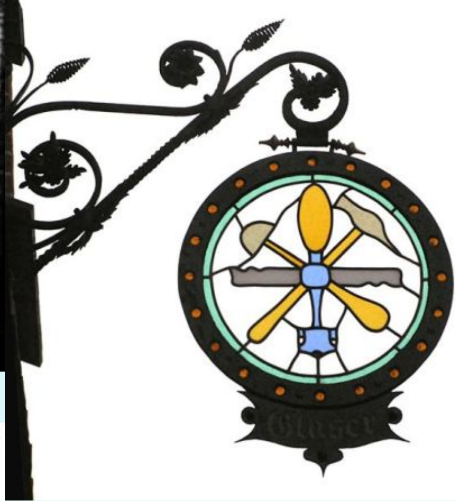
Цеховий знак ремісників по склу