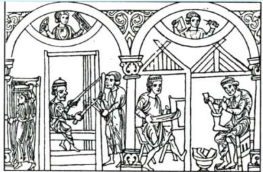
Ремесленники. Мініатюра (начало XIII в.)