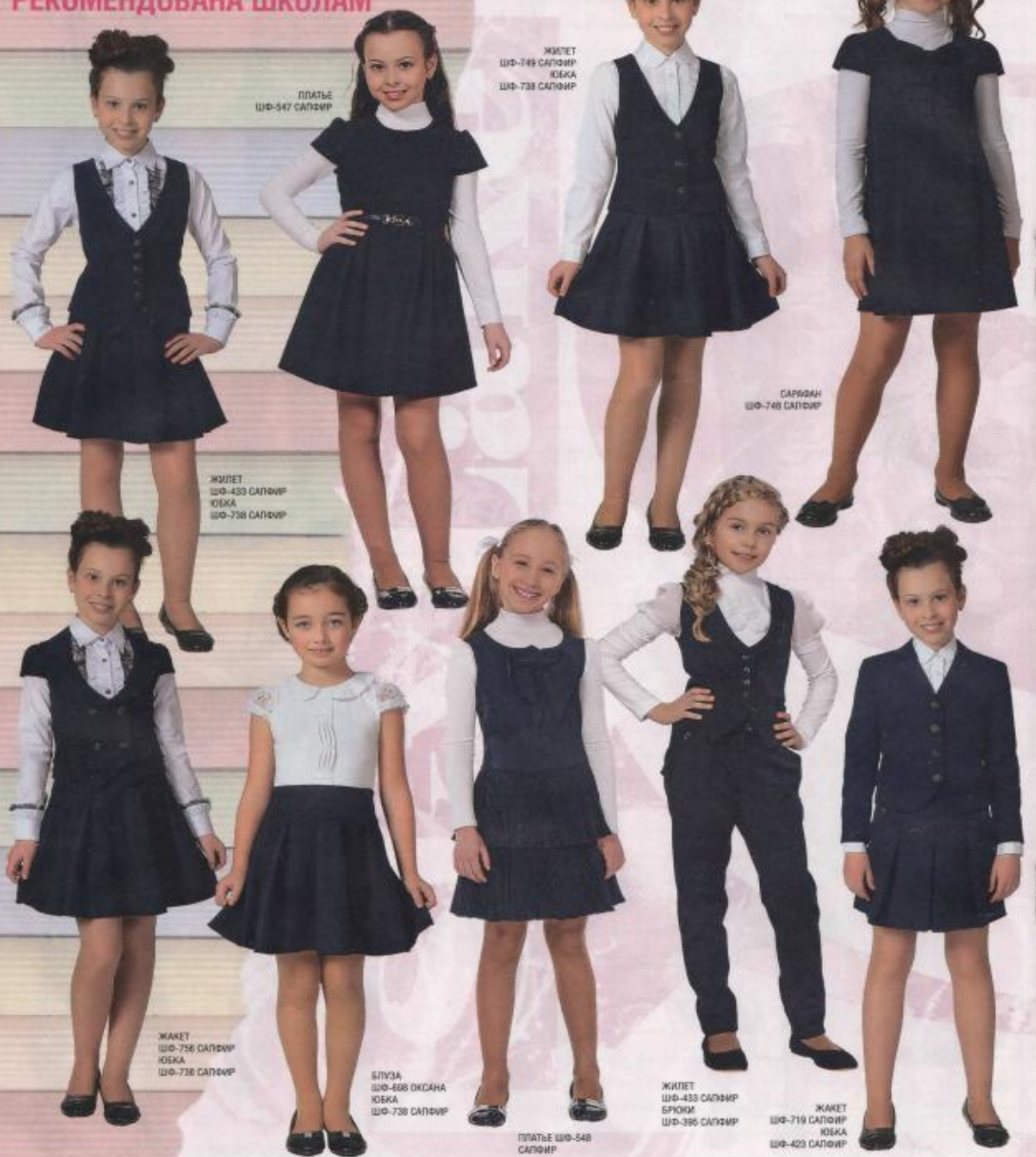
ПЛАТЬЕ ШФ-547 САПФИР