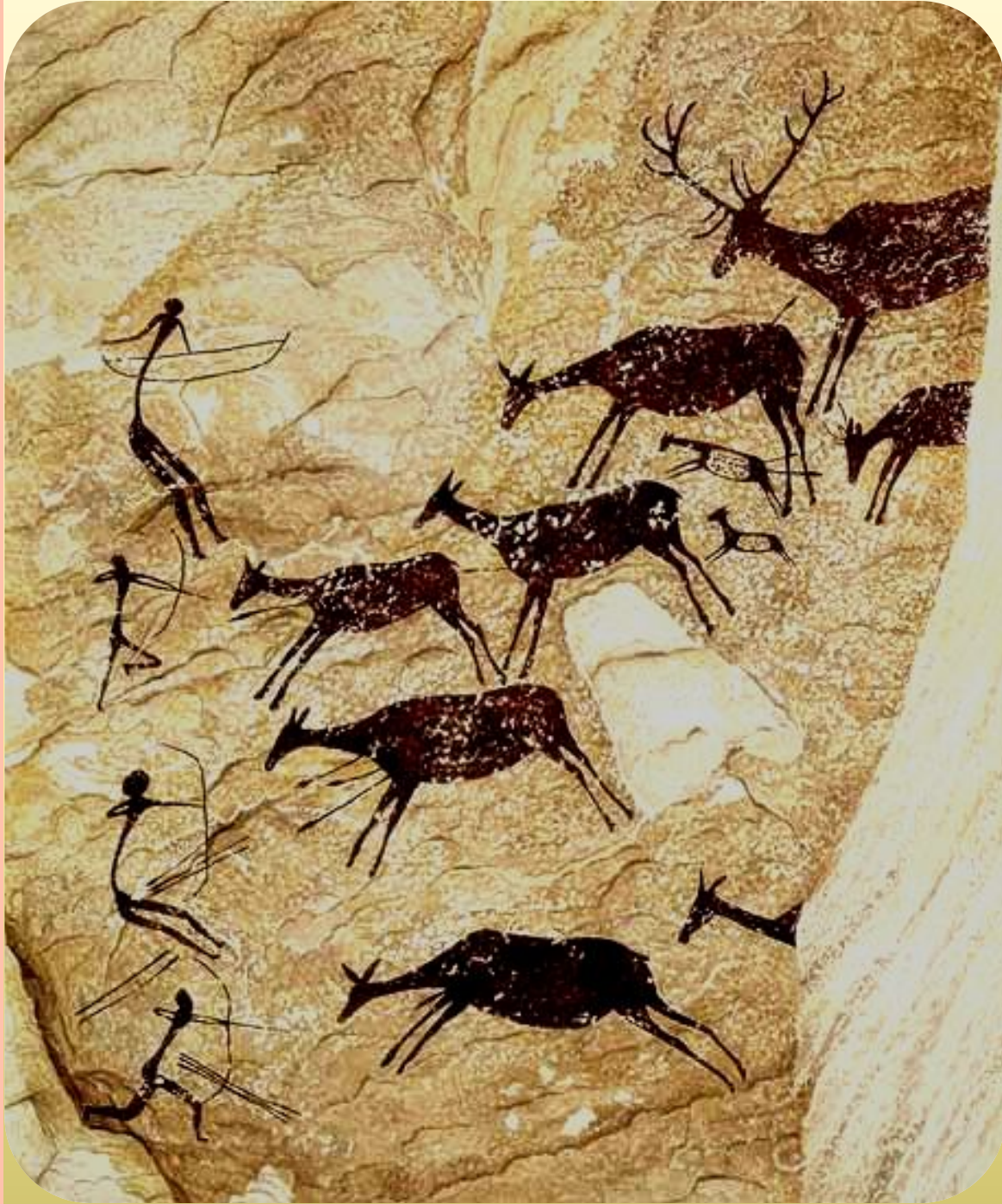
Сражающиеся лучники. Наскальная живопись. Неолит. Валлторта. Испания.