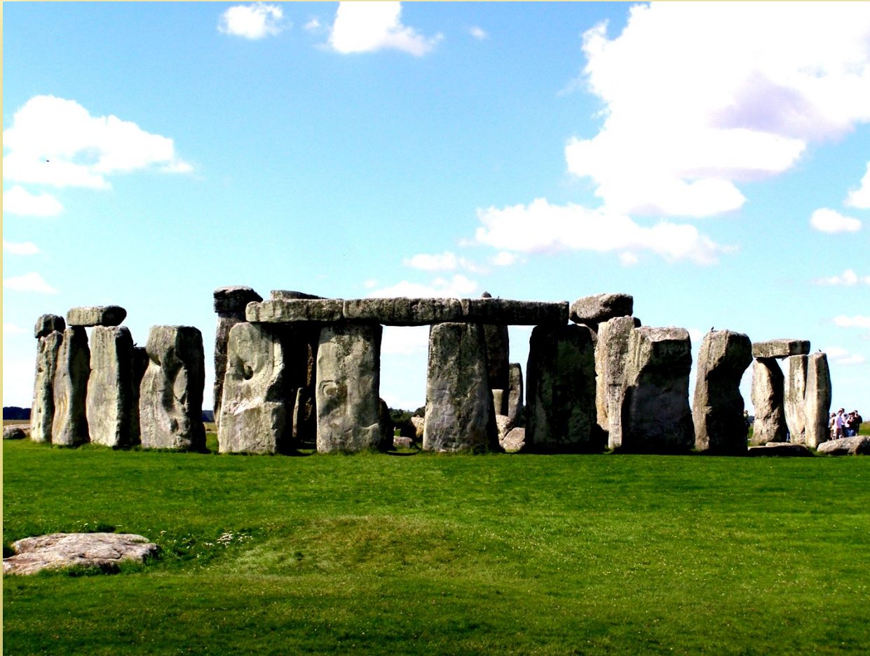
Кромлех. Стоунхендж. 2 тыс. до н.э. Солсбери. Великобритания.

По кругу они перекрыты большими каменными блоками, плотно пригнанными к столбам при помощи вырубленных шипов и гнезд.