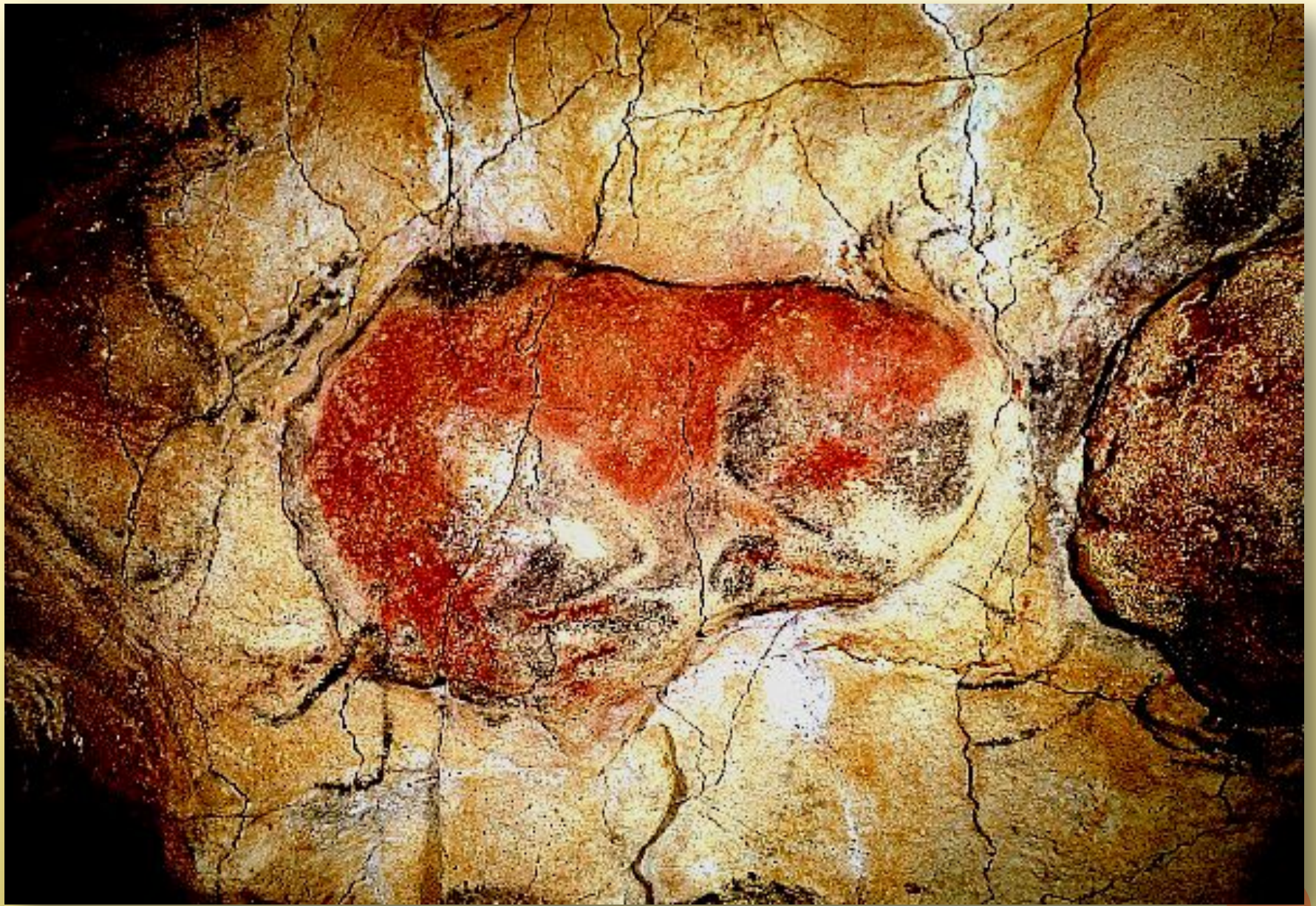
Бизон. Палеолит. Пещера Альтамира. Испания.