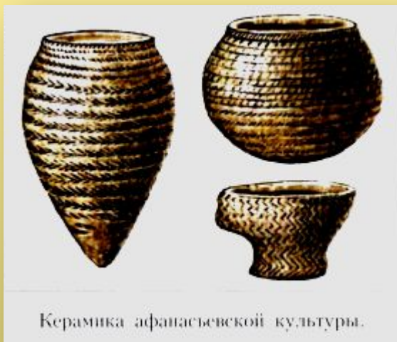
Керамика афанасьевской культуры.