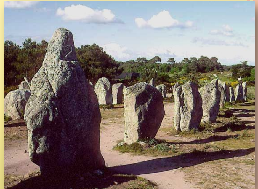
Менгиры. Неолит. Бретань. Франция.