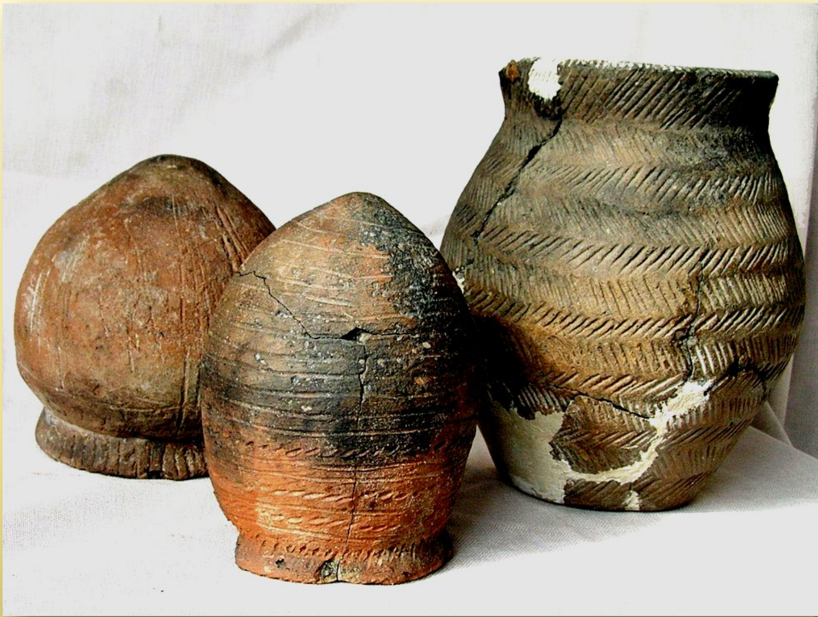
Неолит. 3 тыс. до н.э. Музей Израиля. Иерусалим.