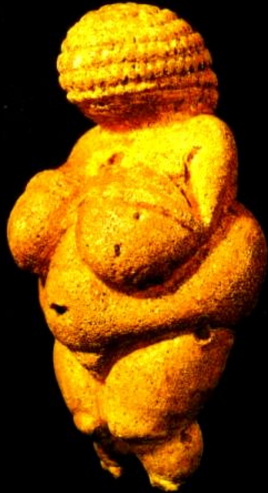
«Венера Виллендорфская». Палеолит. Музей истории искусств. Вена.