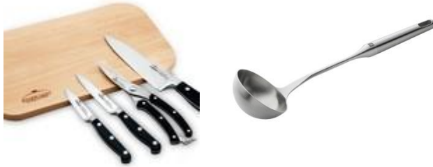
Something for cooker