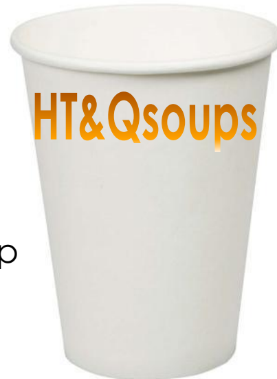
Cup for soup