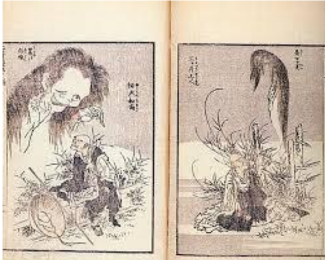
Записки скучного человека