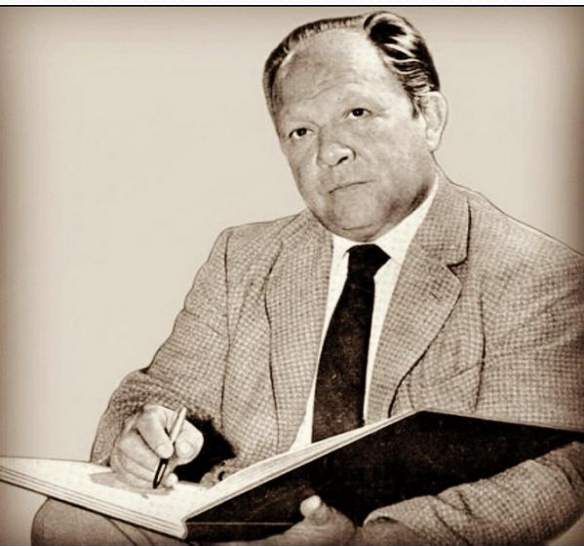
Хосе Асунсьон Флорес- композитор