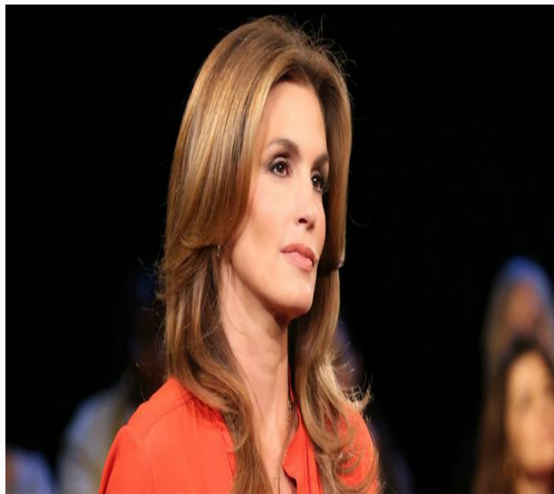
Синди Тейлор -актриса