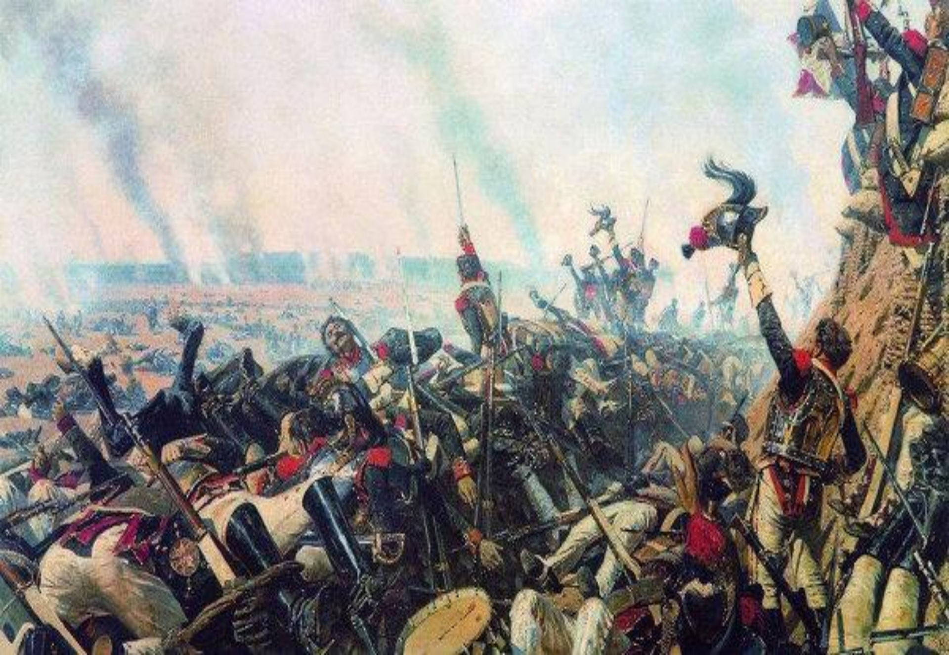
«Конец Бородинского сражения» В. Верещагин