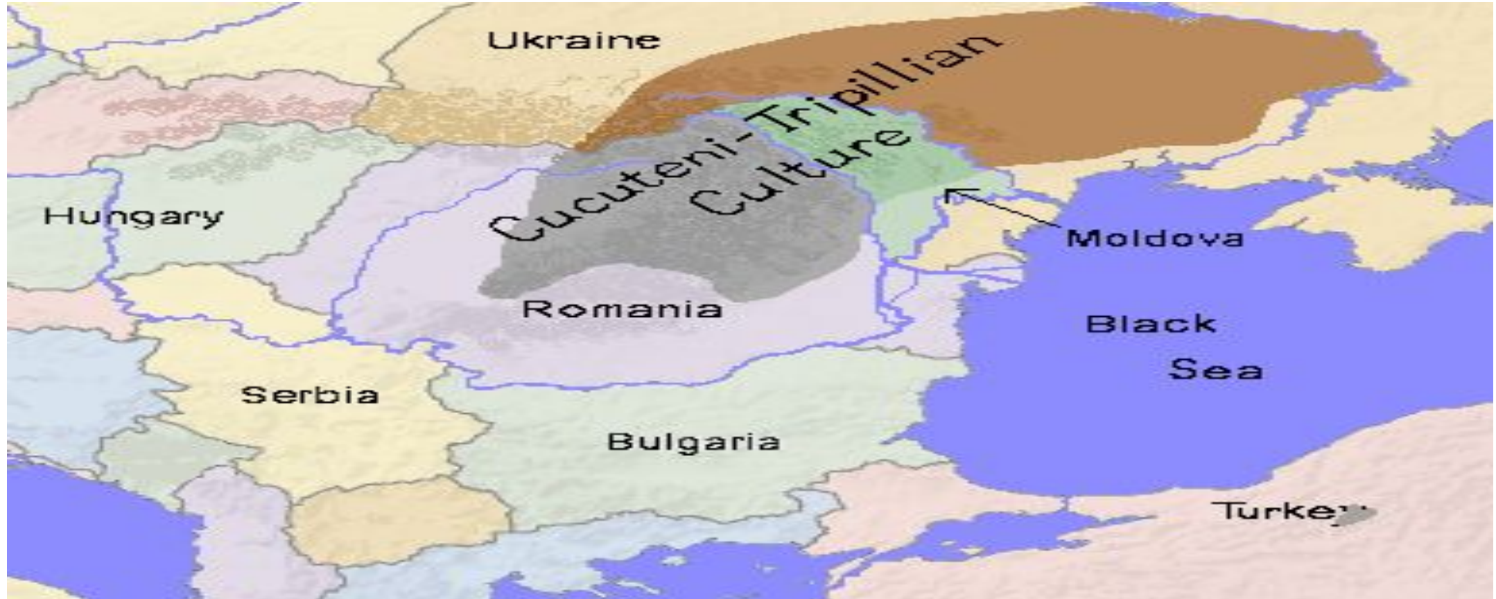
Ареал распространения трипольской культуры

Трипольская культура – археологическая культура, распространённая в VI—III тыс. до н. э. в Дунайско-Днепровском междуречье