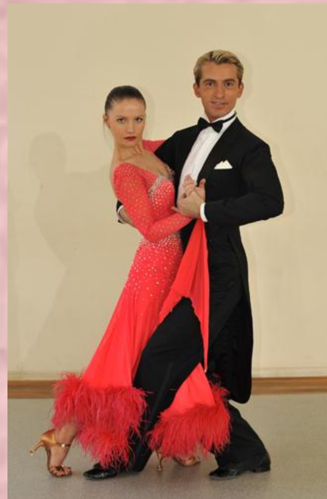
Бальные наряды европейской программы