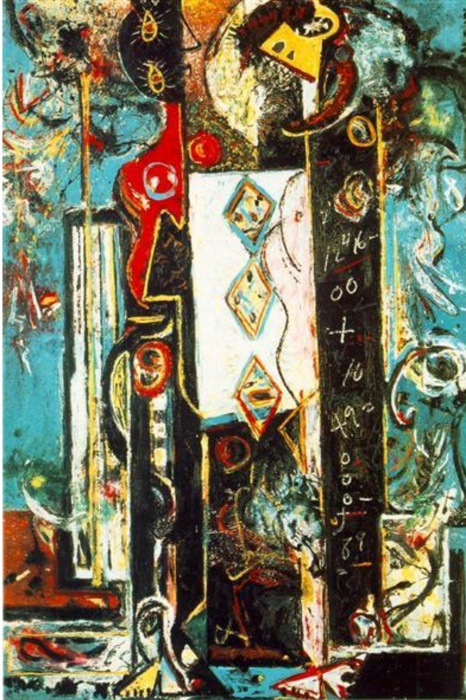
Он и она, 1942