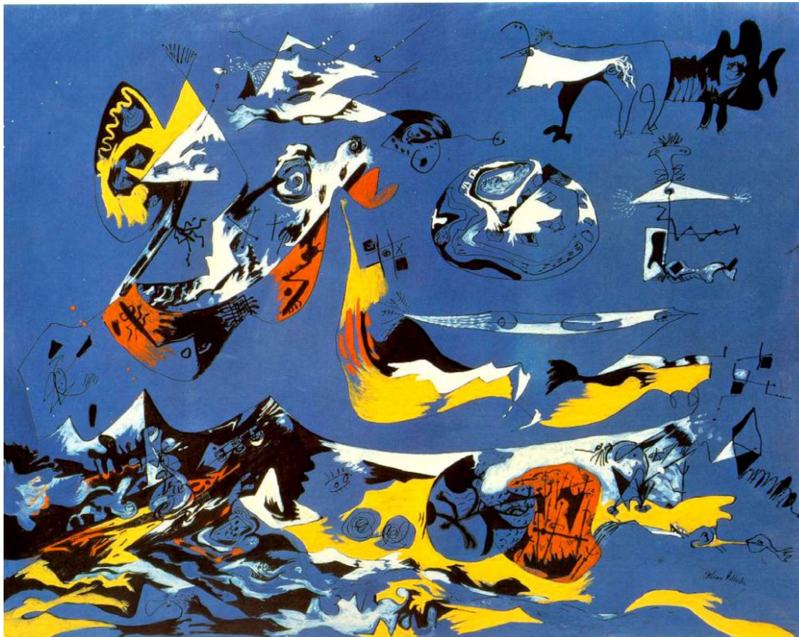
Синий, Моби Дик, 1943