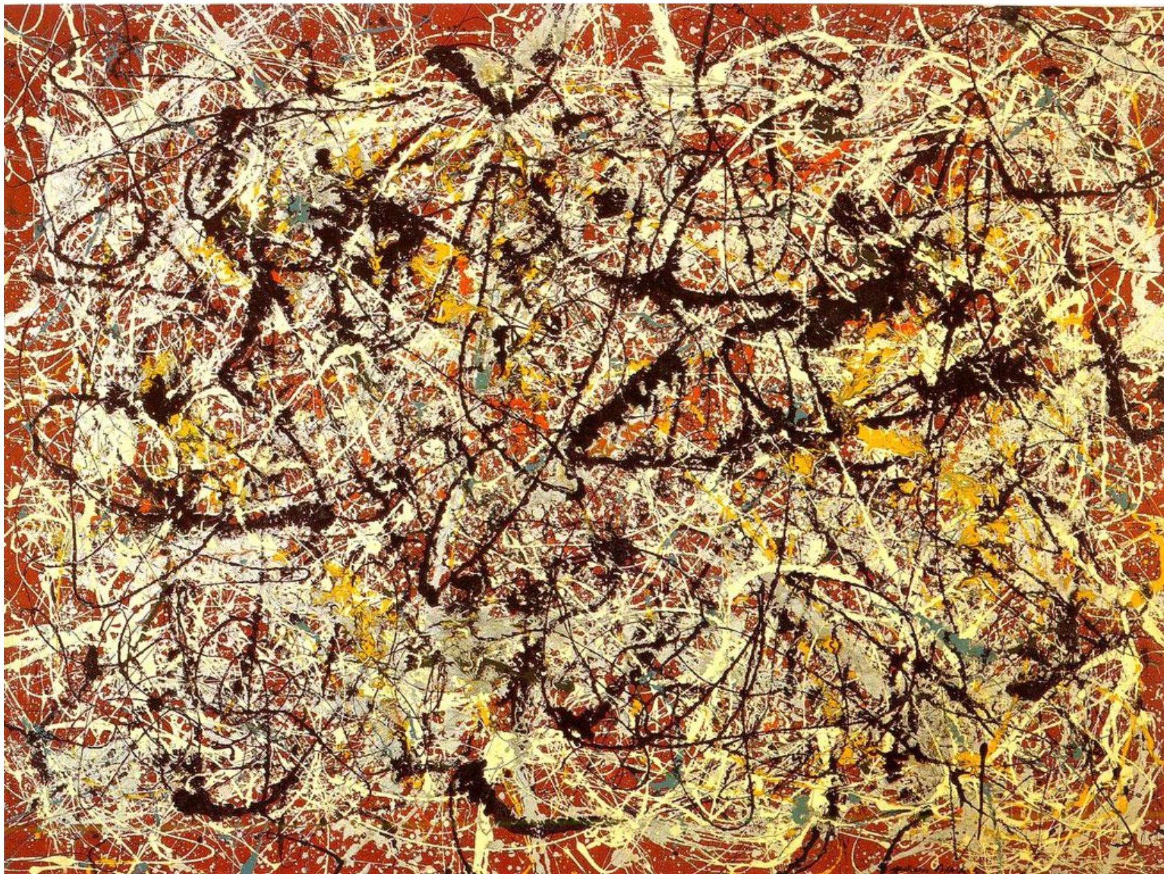
Роспись на индийском красном фоне, 1950