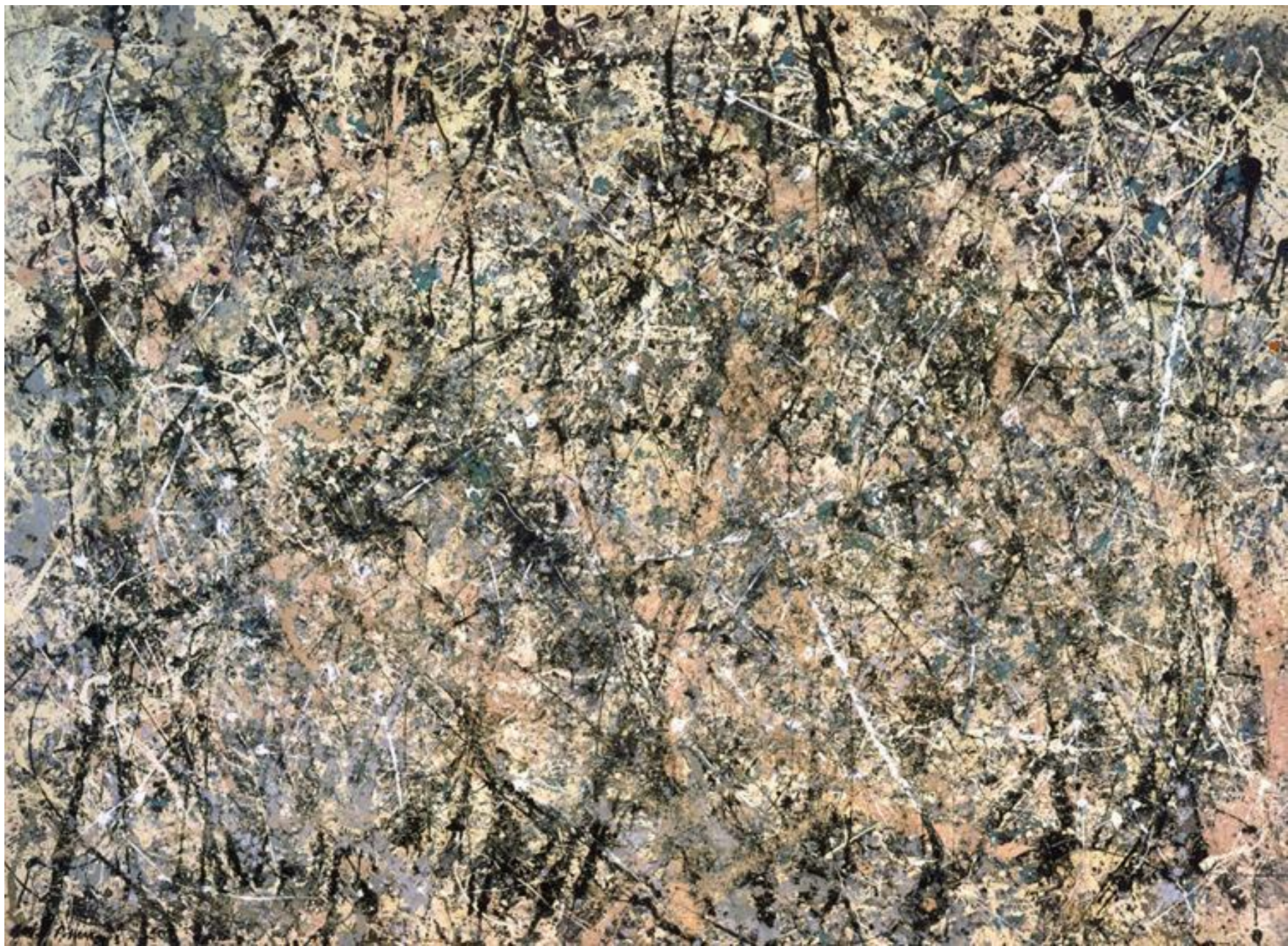
Номер 1, Лавандовый туман, 1950