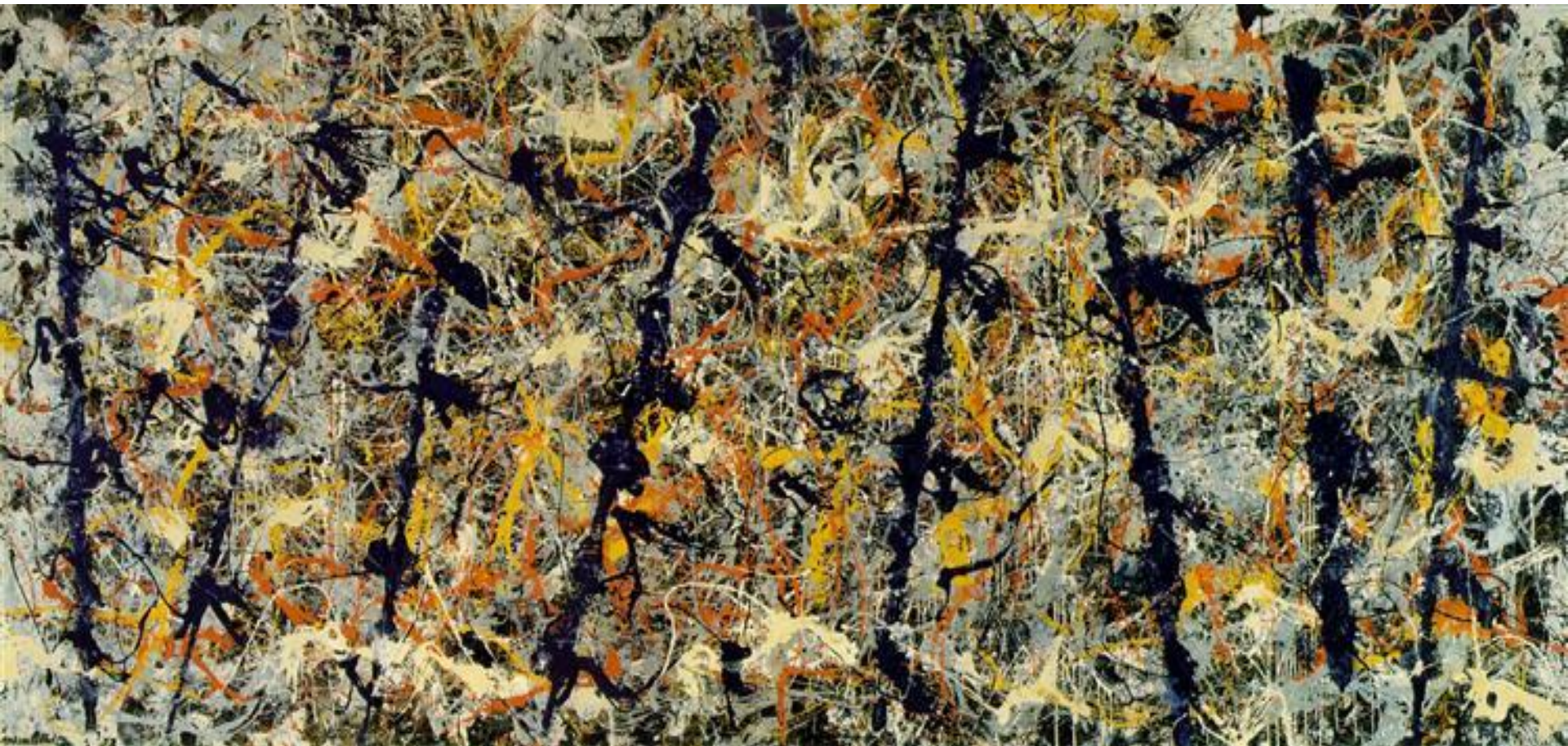
Синие шесты, Номер 11, 1952