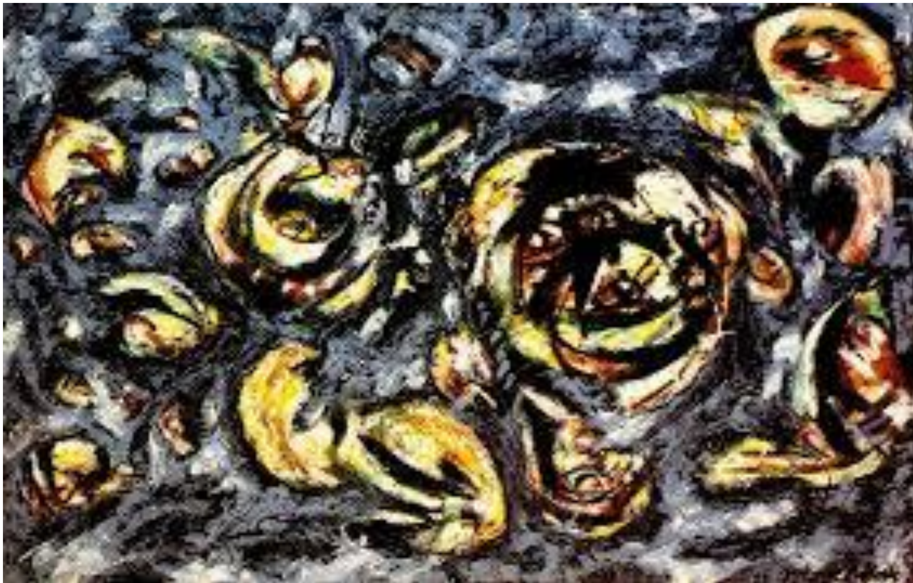
Океан серости, 1953