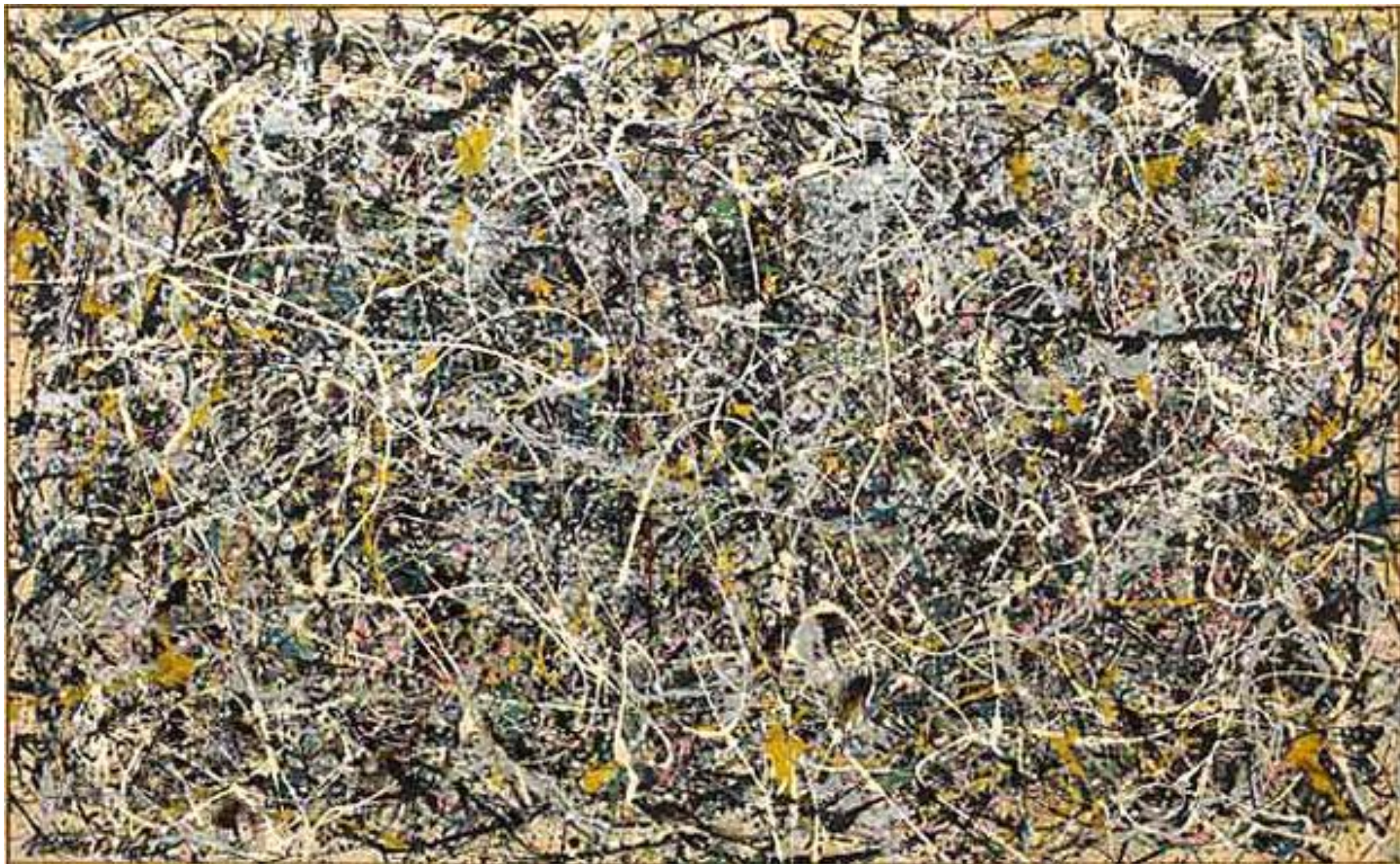
Без названия, Зеленый серебро, 1949