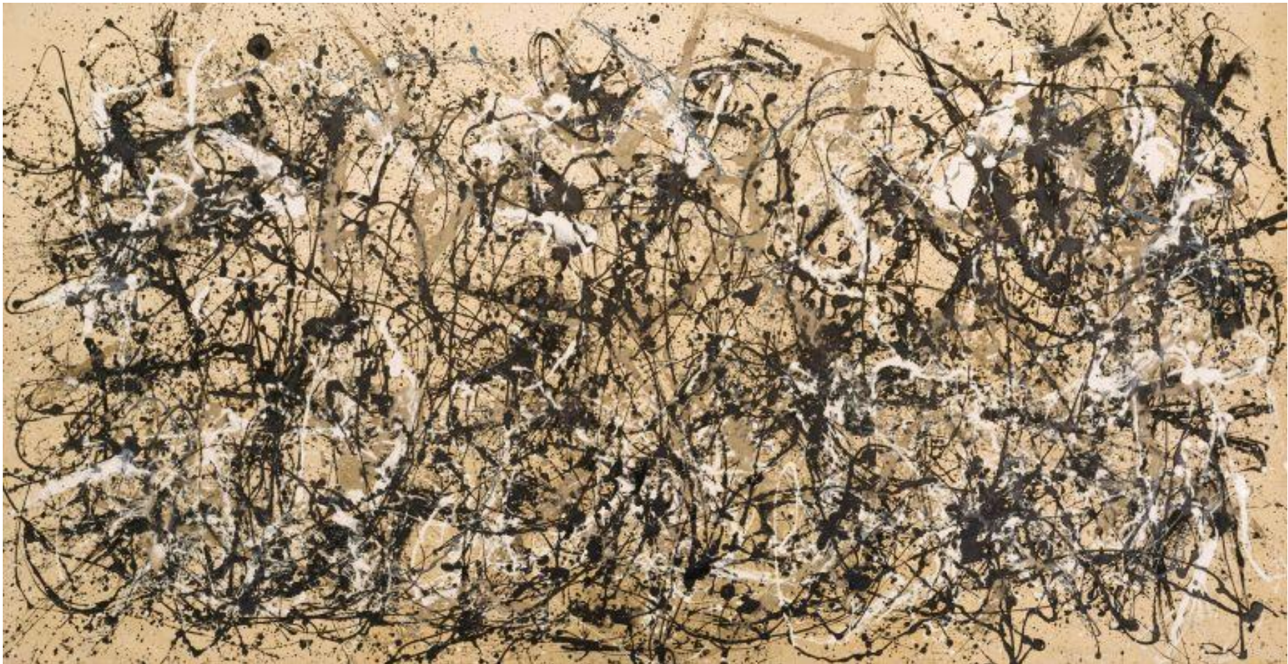
Осенний ритм, Номер 30, 1950