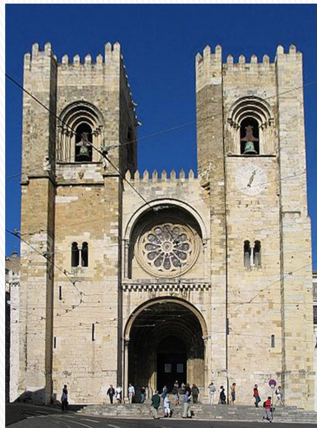
Кафедральний собор Лісабона