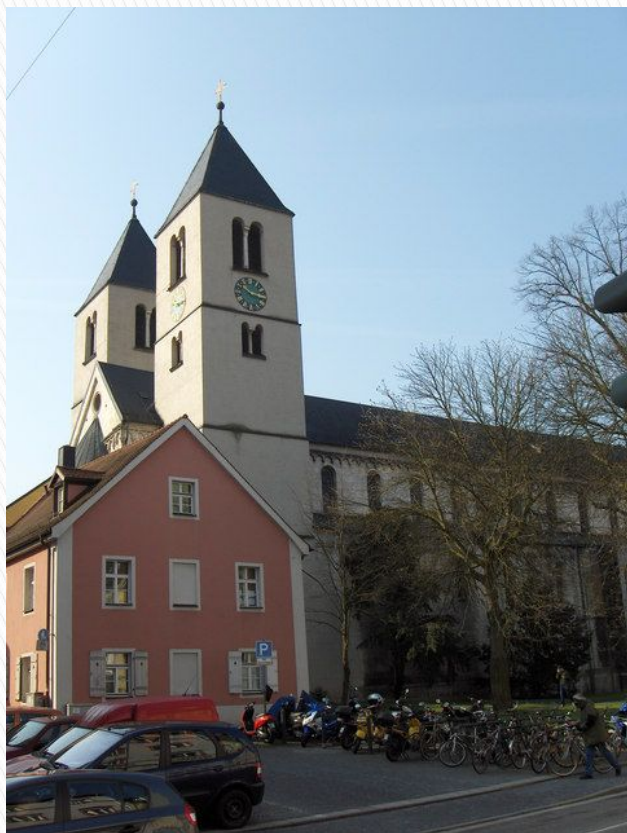
Церква св. Якоба