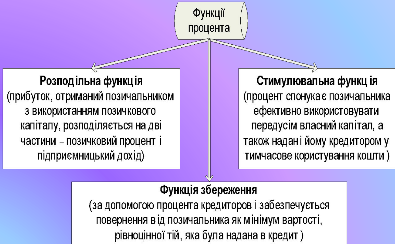
Рис. 12.1. Функції процента