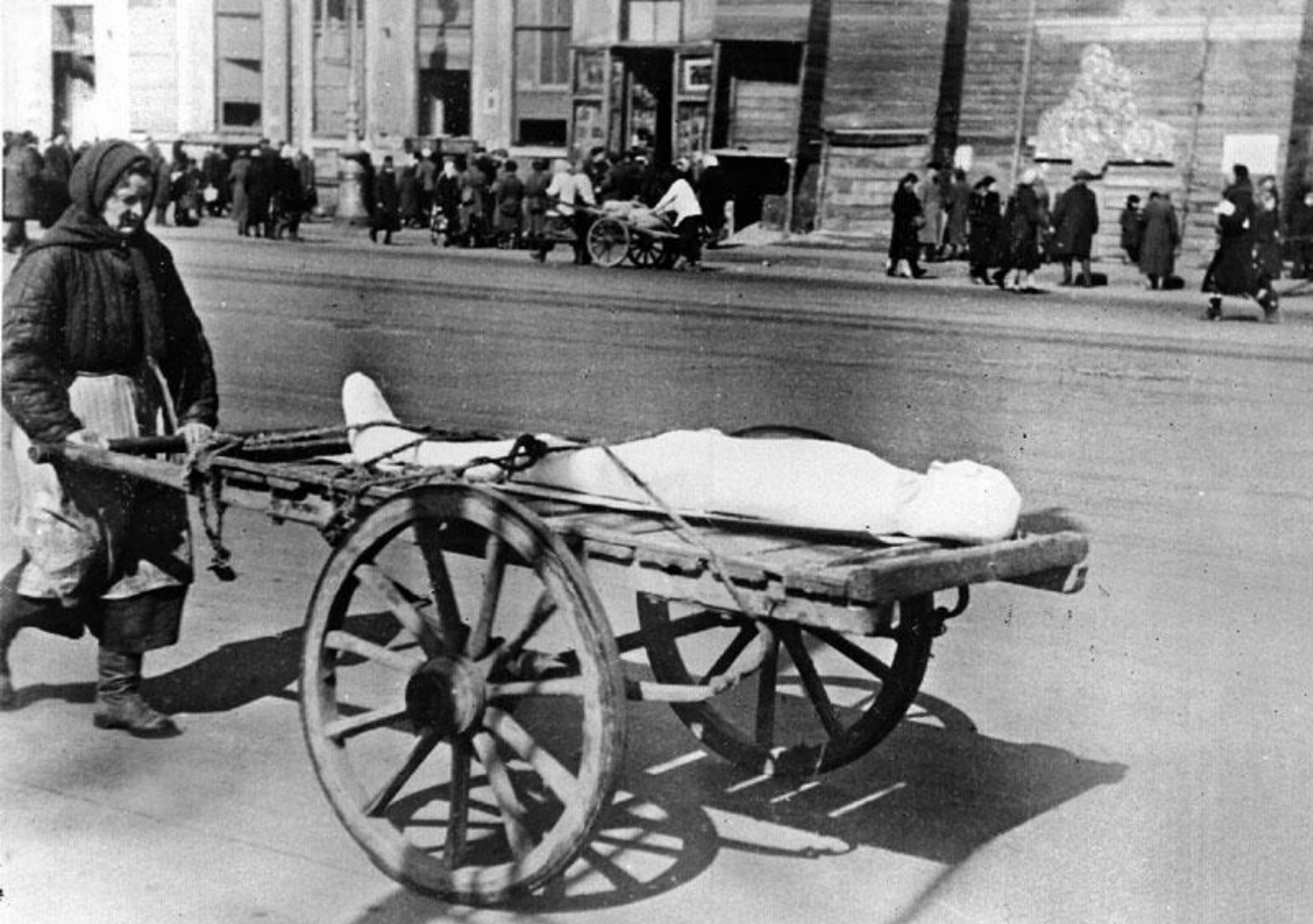
Жертвы блокадного Ленинграда