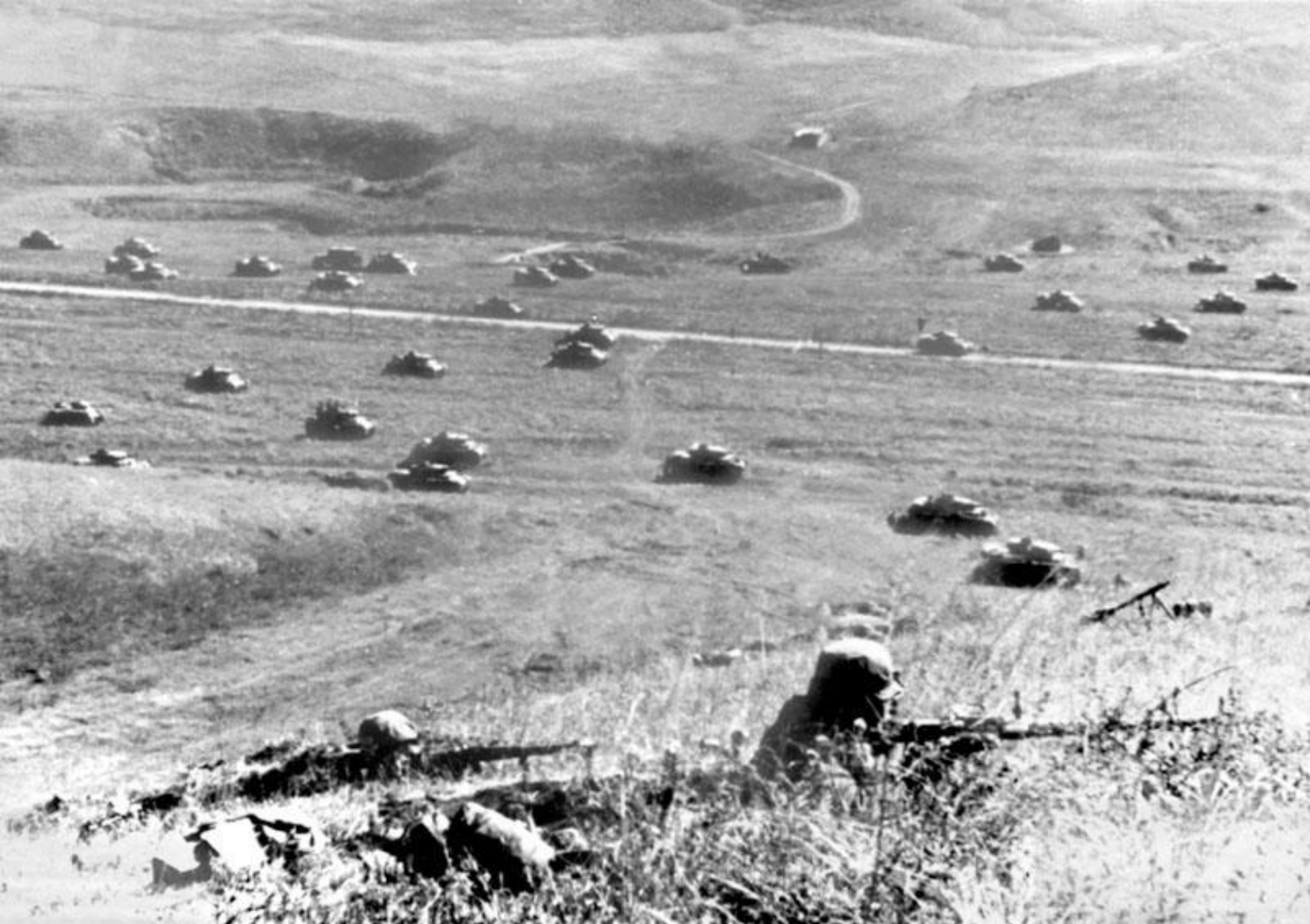
Танковая атака в районе Смоленска