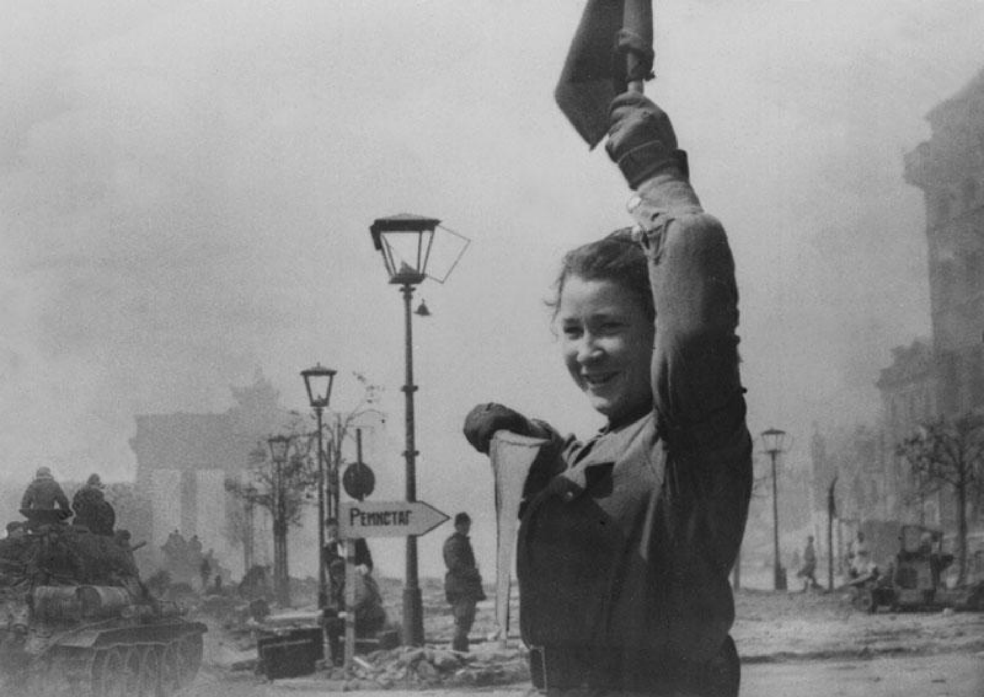
Регулировщица .Берлин 1945 год