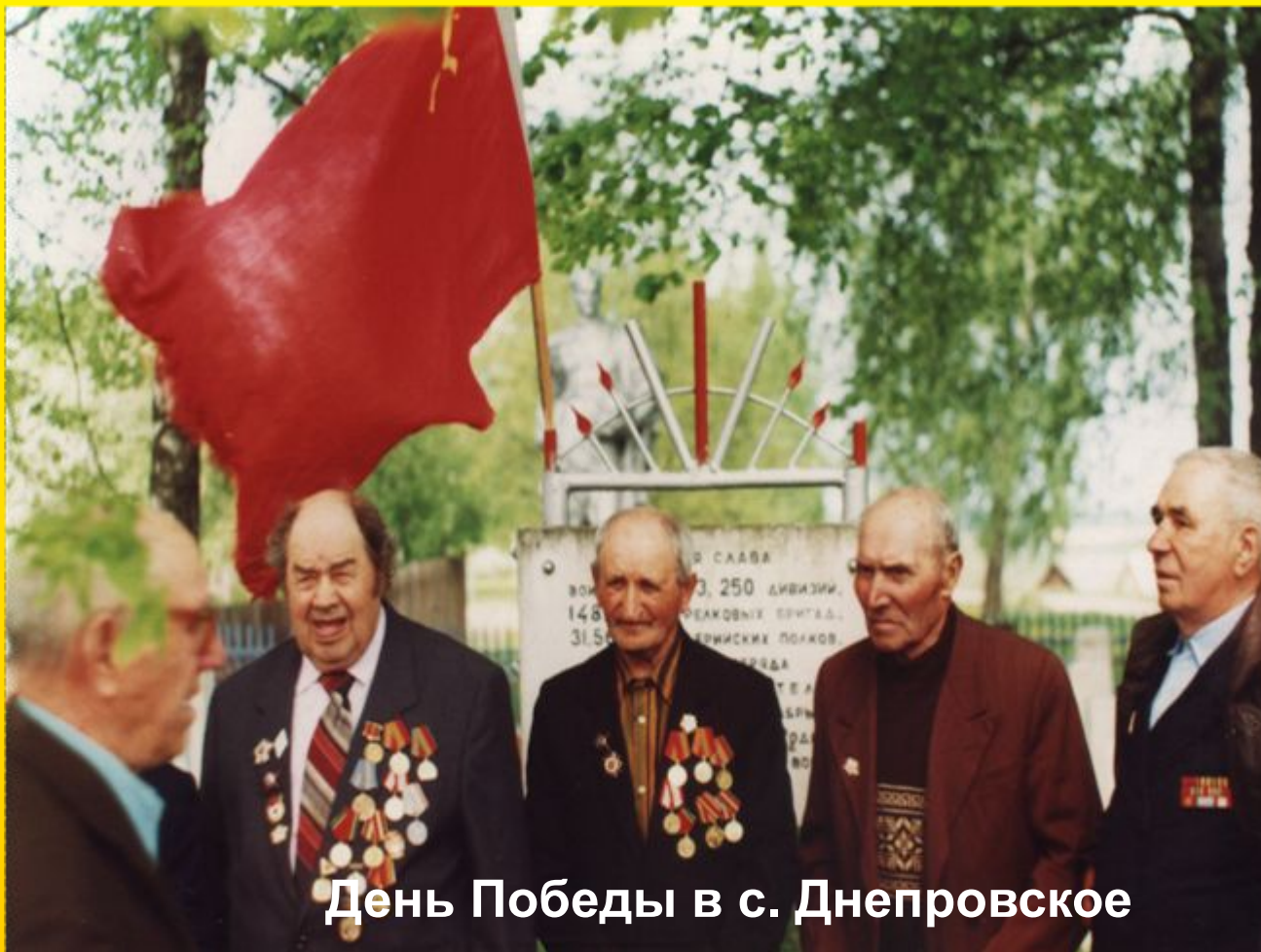
День Победы в с. Днепроовское

Чтоб не пылать земному шару снова, Солдатской крови пролито сполна. Чтоб помнил враг урок войны суровой! Фронтовики, наденьте ордена!