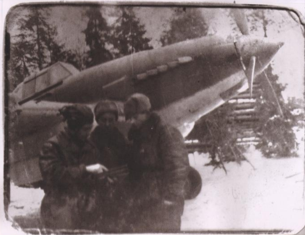
Экипаж эскадрильи возле самолета

«... С первых дней боевой работы показал себя бесстрашным, инициативным и тактически грамотным лётчиком. Глубочайшая ненависть к врагу и беззаветная преданность социалистической Родине вдохновляли молодого патриота на истинно героические подвиги...».