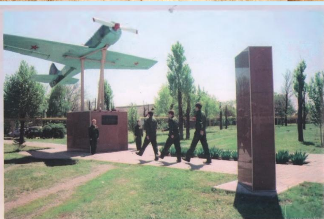
Почетный караул около памятника И.А. Докукину, г. Зверев. 2010 г.