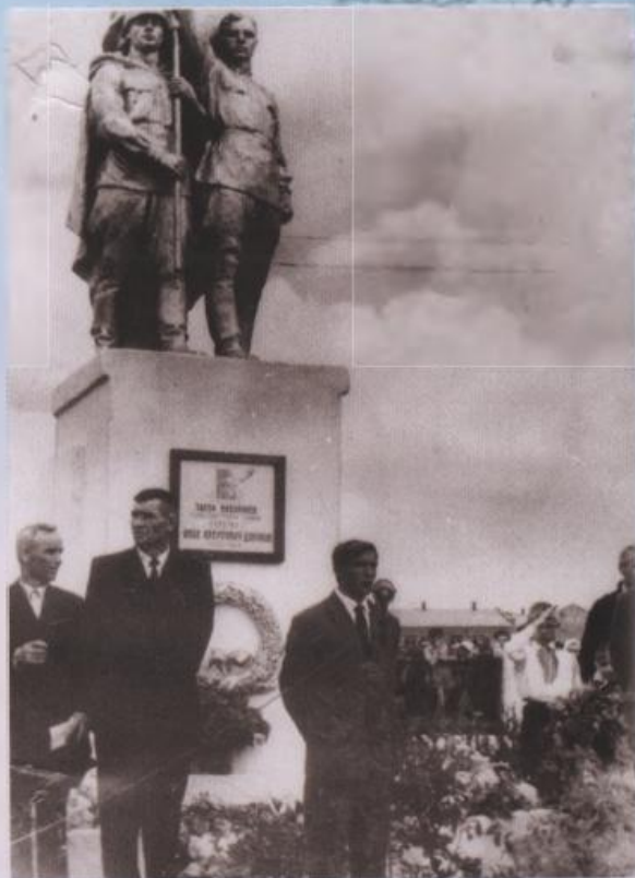
Открытие первого памятника советским воинам и И.А.Докукину, г. Зверев, 1964 г.

Имя Героя Советского Союза И.А.Докукина носят главная площадь Зверева, на которой он похоронен, одна из улиц города и детская библиотека в поселке Новомихайловский. В мае 2010 года, в год 65-летия Победы, на ул. Советской воздвигнут памятник, на постаменте которого установлен самолет. Есть и надпись – «Герою Советского Союза летчику-штурмовику И.А.Докукину...».