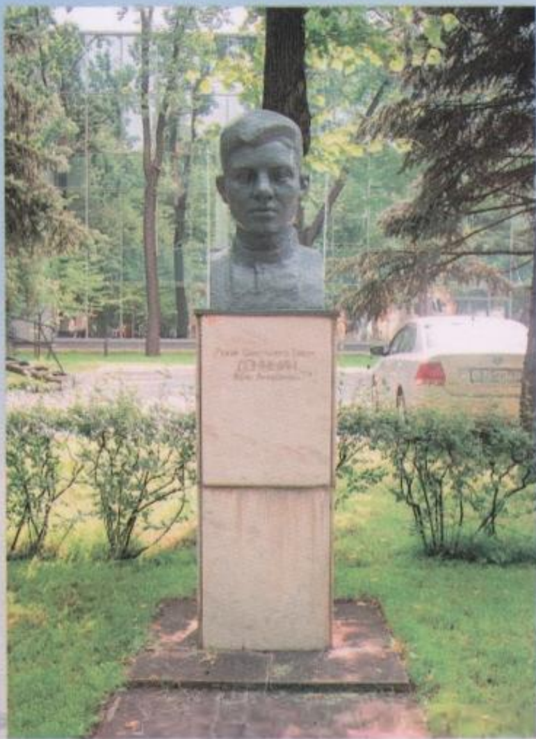
Бронзовый бюст И.А. Докукину на Аллее Героев завода «Калибр», г. Москва.