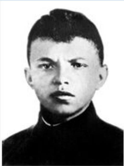
Это Герой Советского Союза Александр Матросов