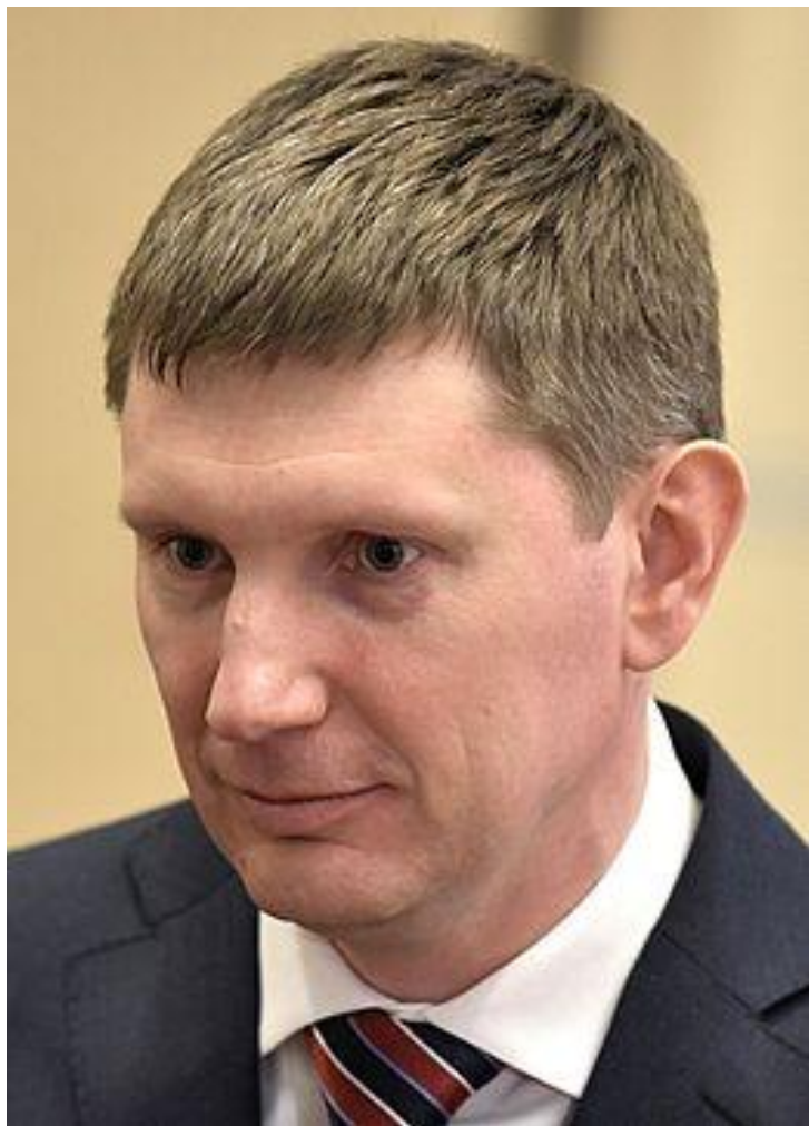
Должность занимает Максим Геннадьевич Решетников (временно исполняющий обязанности) с 6 февраля 2017 года

Возглавляет: Пермский край Кандидатура предлагается: Президентом Российской Федерации Назначается: Законодательным Собранием Пермского края Срок полномочий: 5 лет Должность появилась: 1 декабря 2005 года Первый в должности :Олег Анатольевич Чиркунов