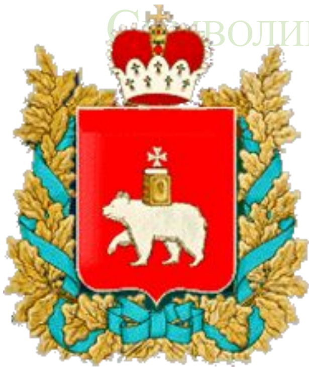
Герб Пермского края