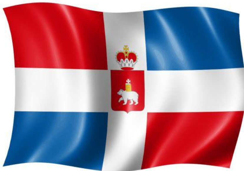
Флаг Пермского края

Выбор в качестве главного символа столицы Прикамья медведя историки объясняют существованием у племен, населявших те края, культа этого зверя. Возможно, именно с языческих тотемов медведь переключался на печати, которыми скреплялись грамоты первых пермских воевод, а затем и на герб Пермского края.