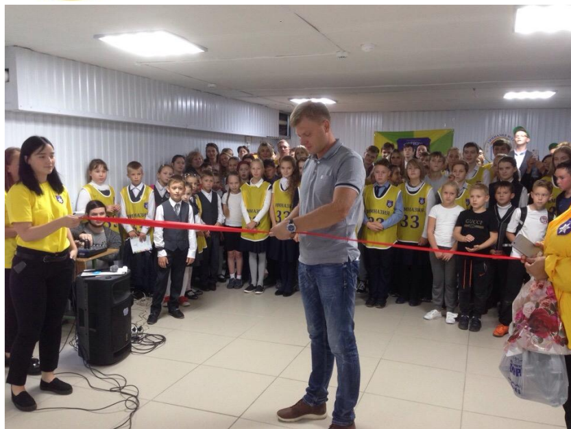
Открытие теннисного зала