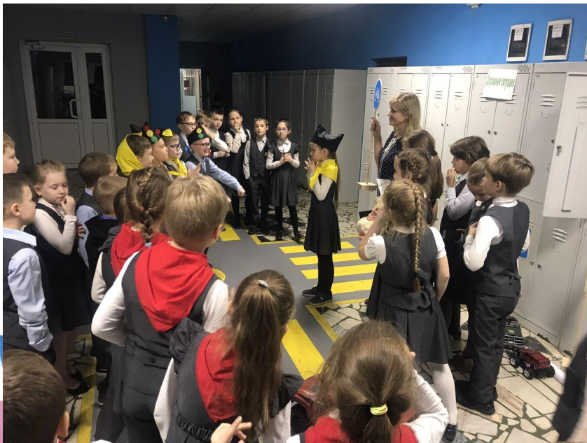
Волонтерский проект 3Б класса «Тайна дорожных знаков»