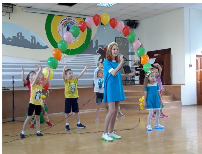
Семейный музыкальный фестиваль «Семья в семь нот»

Реализация социально значимого проекта «Семейный Культурно-досуговый центр», который является победителем 20-го городского конкурса социально значимых проектов «Город – это мы» (номинация «Семья – основа общества»).