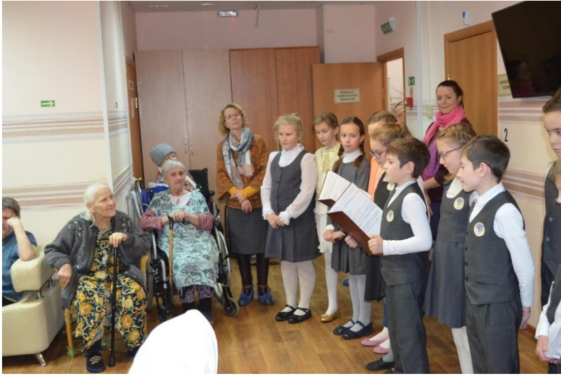
Волонтерский проект 4А класса "Доброе сердце"