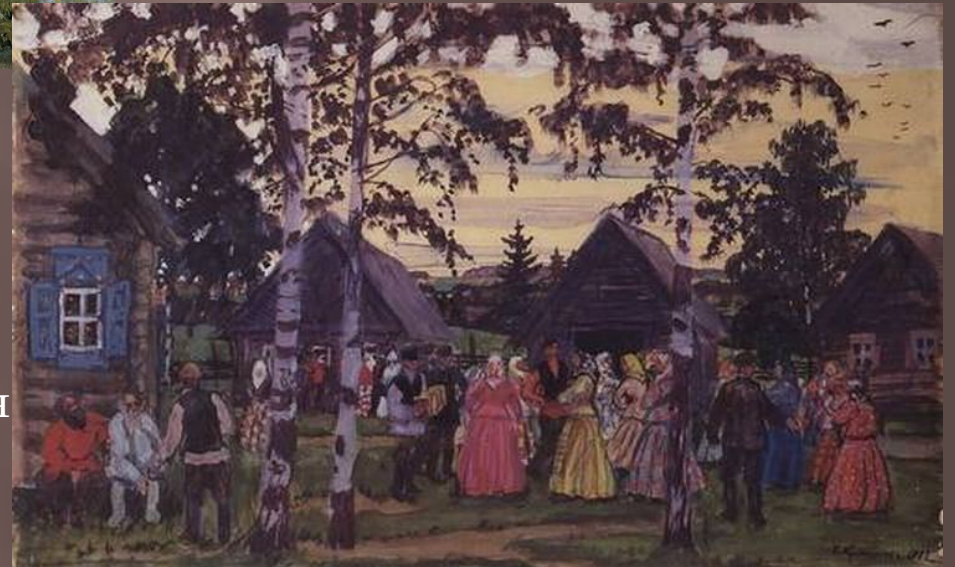
Кустодиев Борис Михайлович «Хоровод»