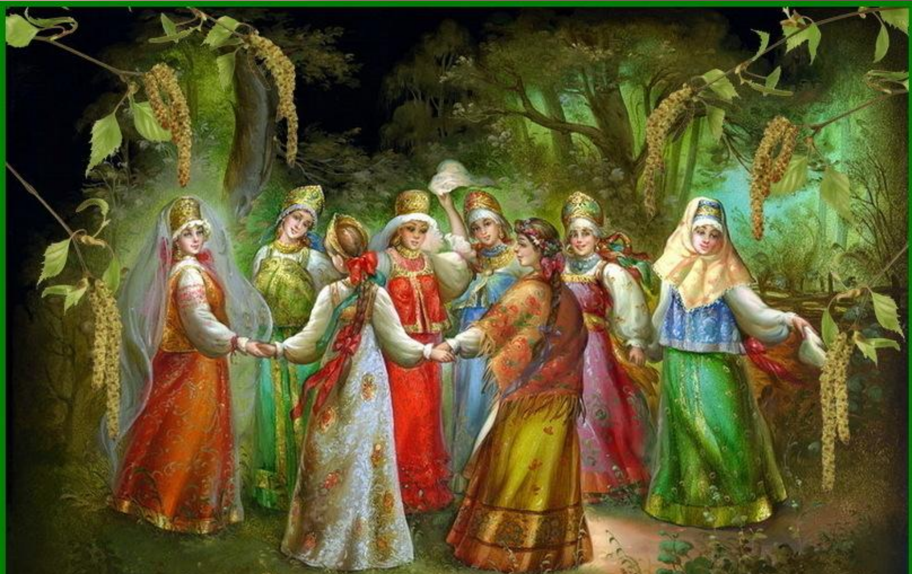
Русский праздник "Красная горка"