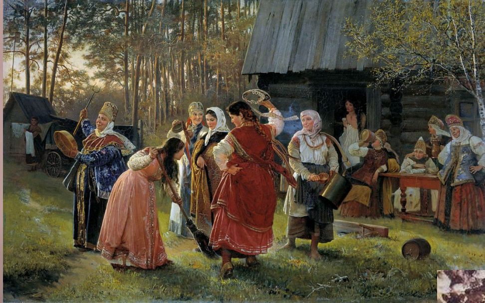
Корзухин Алексей Иванович «Девичник»