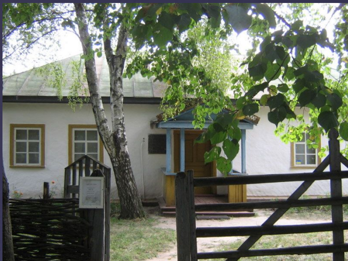
Музей Шолома-Алейхума у Переяслові