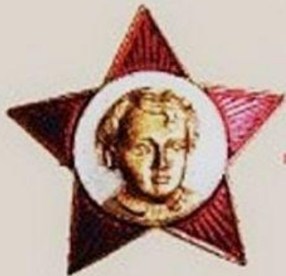
Октябренок Школьники с 7 до 9 лет.

В каком возрасте советские молодые люди могли вступать в Комсомол?