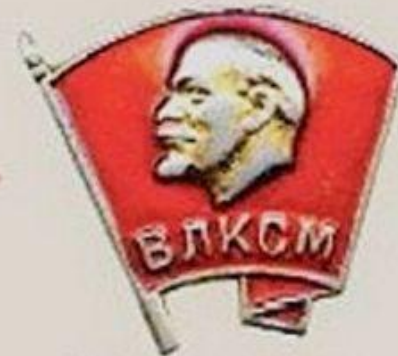
Комсомолец Молодежь с 14 до 28 лет.