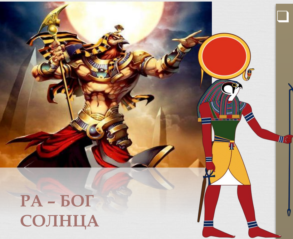
РА – БОГ СОЛНЦА

Среди мифов о борьбе бога солнца с врагами выделяются два основных – миф о битве Ра со змеем Апопом и миф о Горе Бехдетском, сыне Ра.