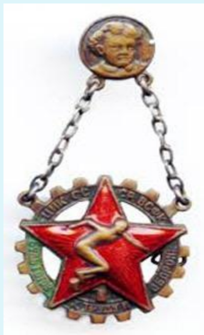
Значок БГТО образца 1934 года

Через несколько лет после введения, комплекс ГТО обрел такую популярность, что уже в 1934 году в стране насчитывалось около 5 миллионов физкультурников, половина из которых гордо носила на груди значок ГТО.