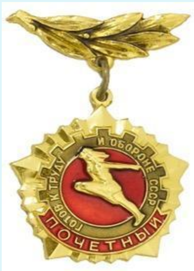
Почетный знак ГТО

«Почетный знак ГТО» вручался тем, кто выполнял нормативы в течение нескольких лет подряд.