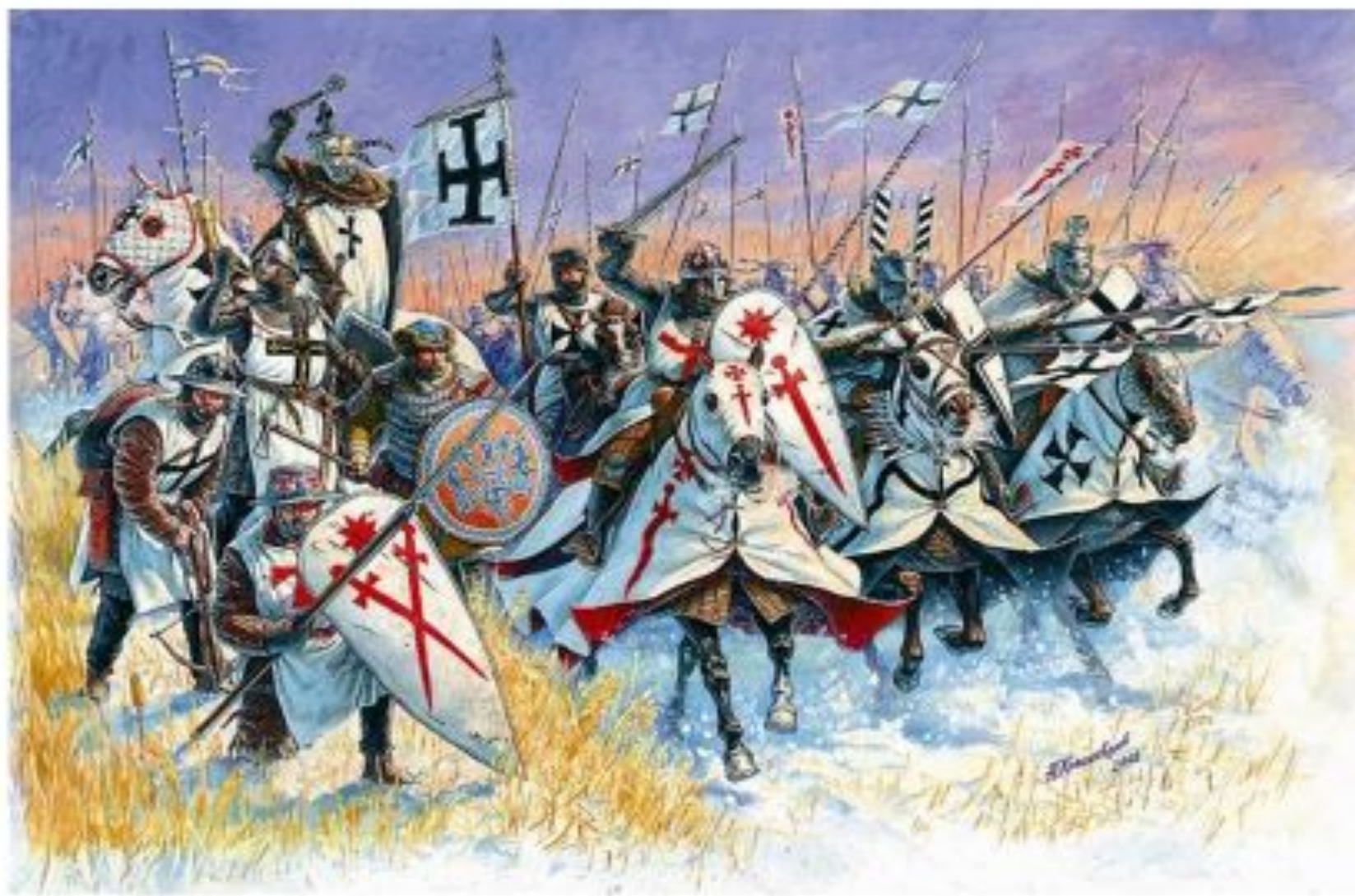
Рыцари Ливонского ордена