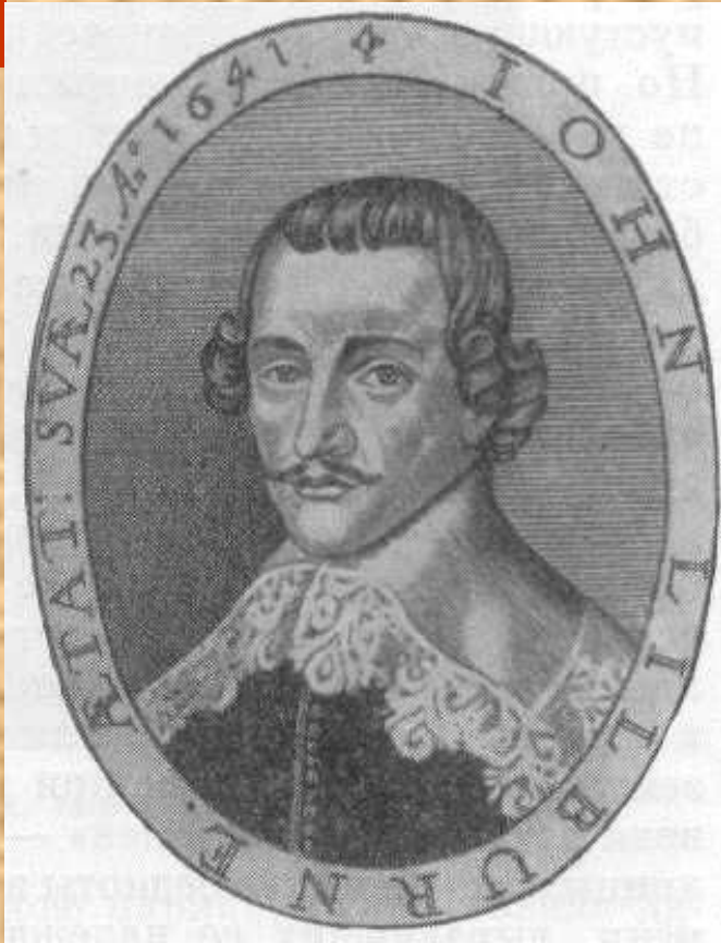
Джон Лильберн – лидер левеллеров (уравнителей)