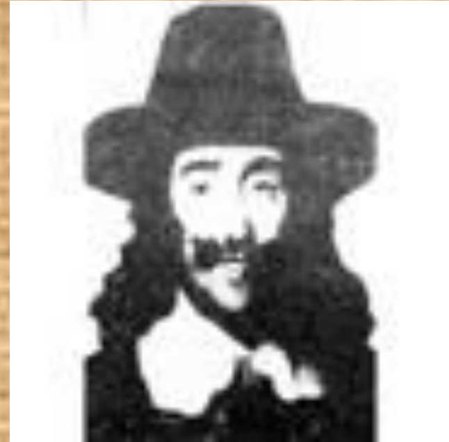
Джерард Уинстенли – лидер диггеров (копателей)