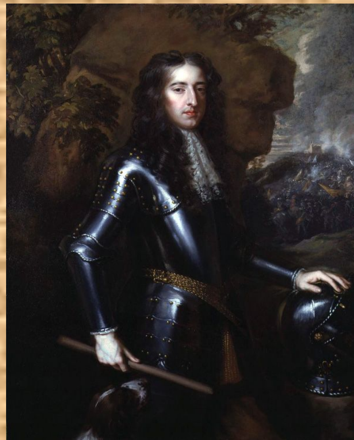
Вильгельм III Оранский