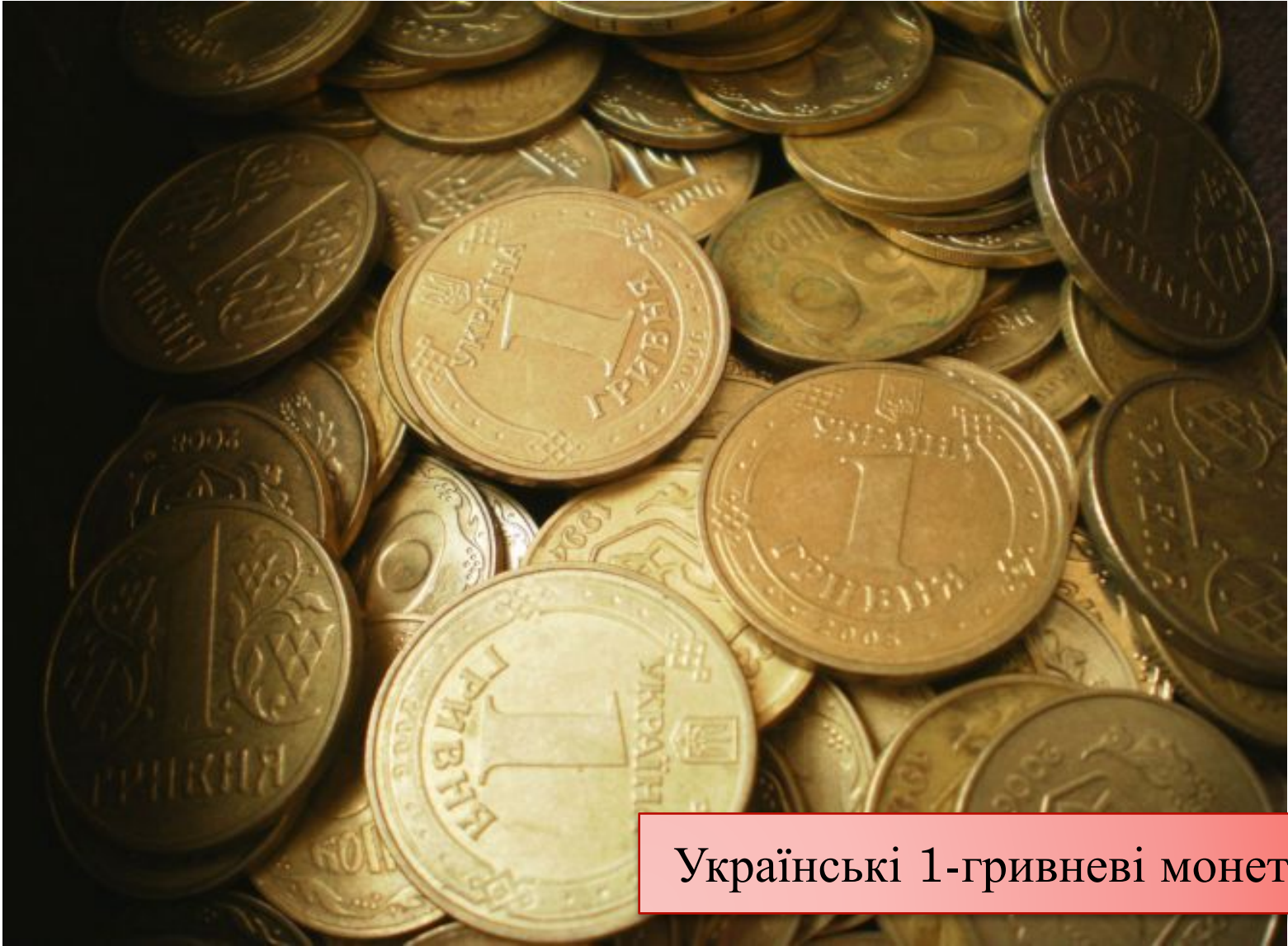
Українські 1-гривневі монети

це функція, в якій гроші є посередником в обміні товарів і забезпечують їх обіг.