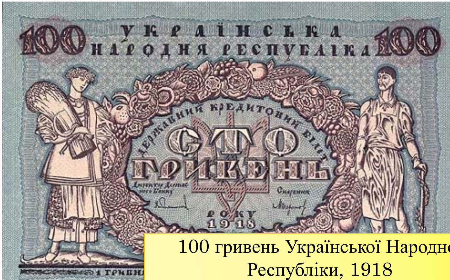
100 гривень Української Народної Республіки, 1918