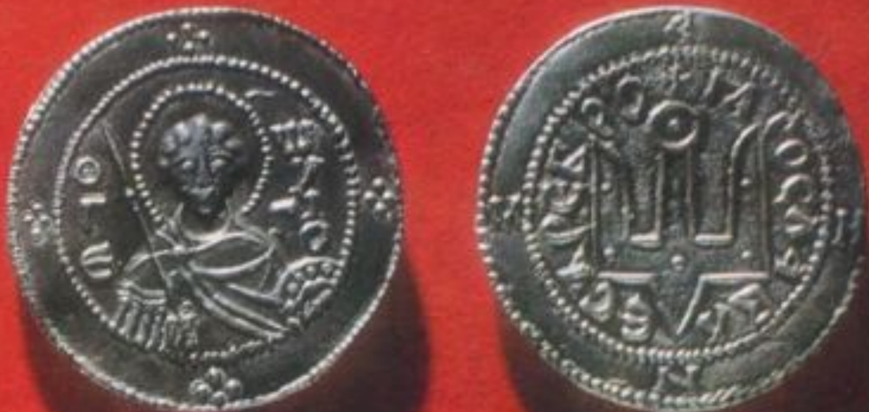
Срібляник Ярослава Мудрого (1019–1054). Лицьова — св. Георгій, зворотна — тризубець

Функції грошей - це дії, які вони здійснюють у ринковій економіці.