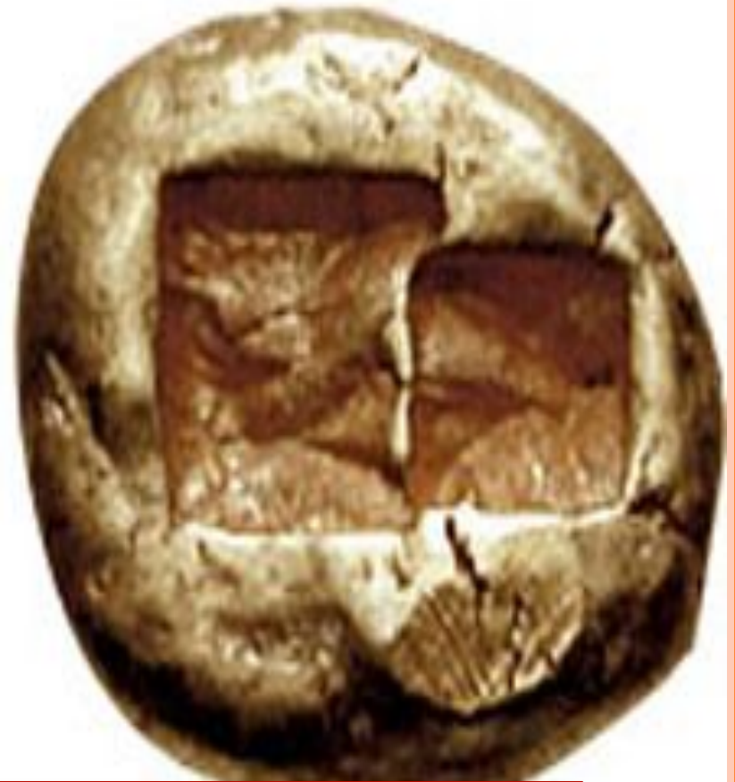
Монета 6 ст. до н. е., Лідія