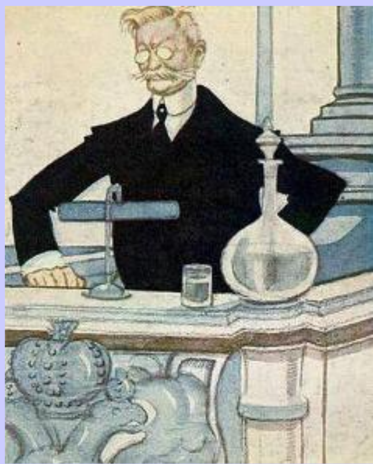
Шарж на П.Н.Милюкова

Временное правительство не стремилось решать задачи стоящие перед страной. 18 апреля Милюков обратился с нотой к союзникам России и заявил о готовности продолжать войну. Это вызвало взрыв возмущения. В столице начались антивоенные и антиправительственные демонстрации. Правительство начало наступление на фронте, но оно провалилось. 5 мая был сформирован 2 состав Временного правительства.