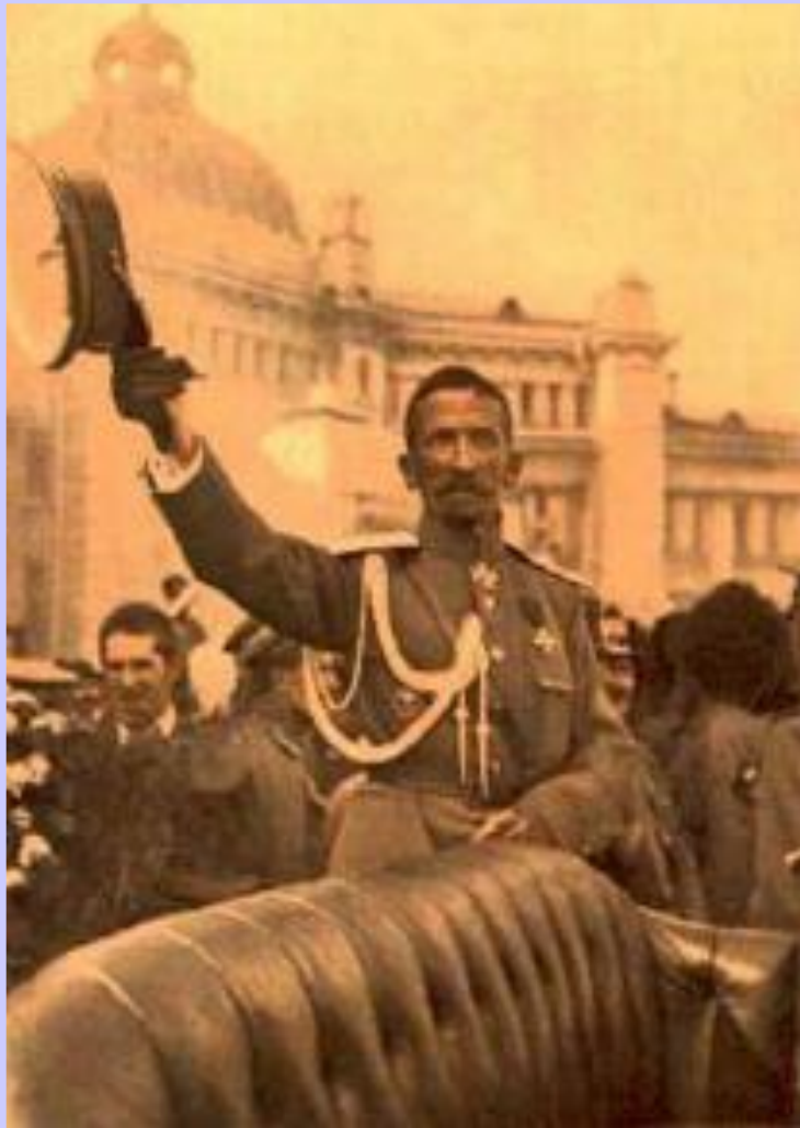
Приезд Л.Корнилова в Москву.

На совещании Корнилов и Керенский готовы были объявить о введении диктатуры, но рабочие Москвы не позволили этого сделать. 23 августа, сняв войска из-под Риги, Корнилов двинул войска на Петроград. Керенский испугавшись объявил его предателем. Временное правительство фактически самораспустилось. Над страной нависла угроза установления военной диктатуры.