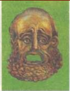
Театральная маска. Древняя Греция