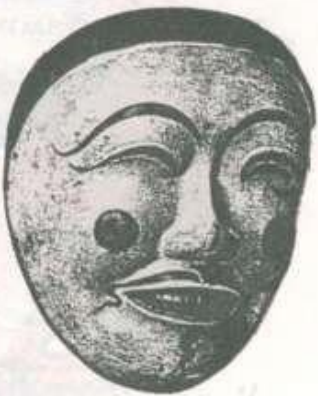
Японские старинные театральные маски

Маска пришла к нам из глубокой древности. Она даже древнее куклы. У каждого народа были свои маски. Их делали из золота и серебра, украшали драгоценными камнями, выдалбливали из дерева, вырезали на них орнаменты и узоры. Потом праздники и представления перешли с городских площадей на театральную сцену и появились театральные маски.