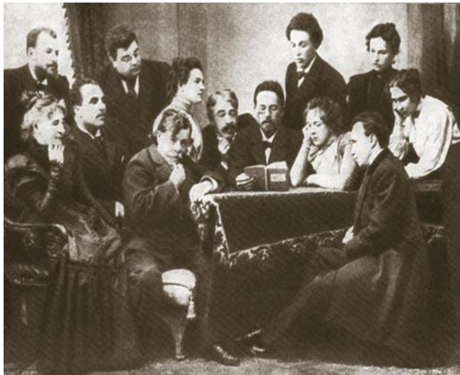
А. П. Чехов с артистами Московского Художественного театра.

В конце 1880 он много работал для театра: пьесы "Иванов", "Леший", "Свадьба", водевили "Медведь", "Юбилей" и др.