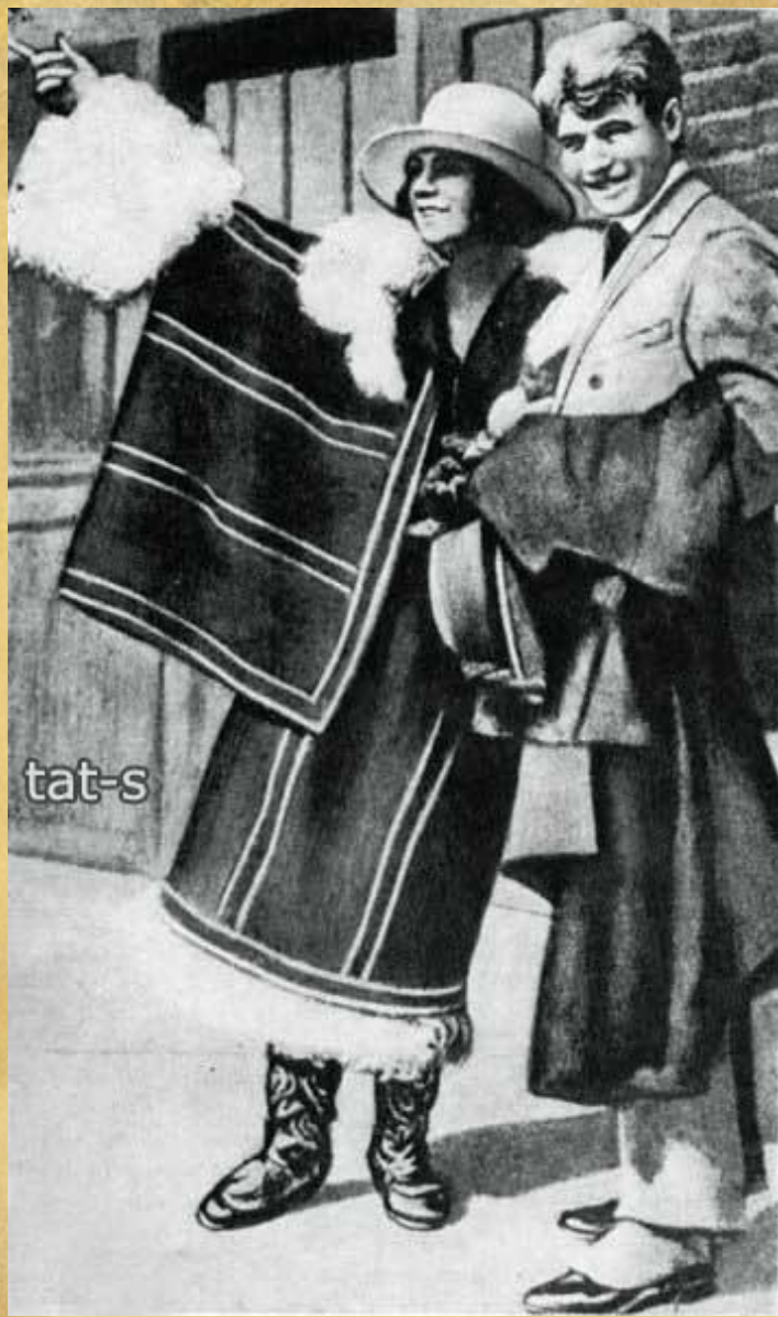
Сергей Есенин и Айседора Дункан на парохде "Paris". Фото (3) - 1 октября 1922 год