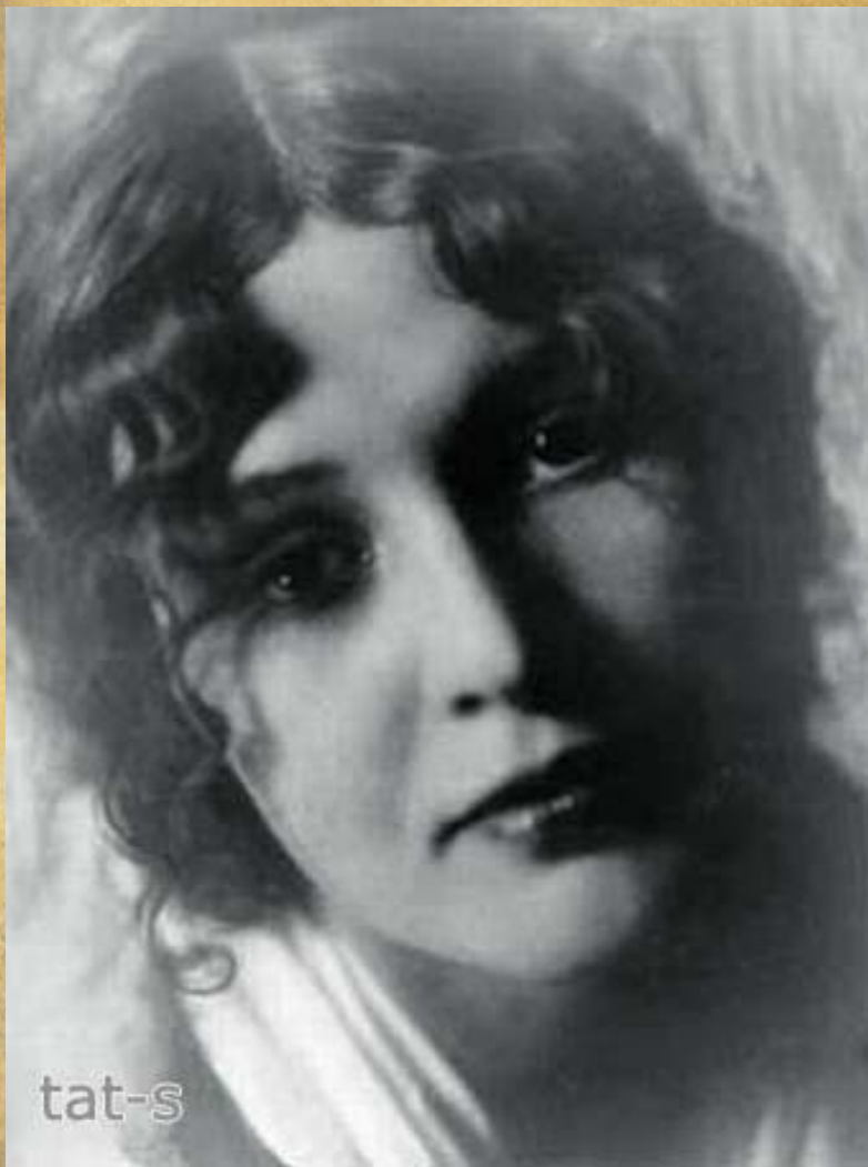
Жена Есенина, актриса - Зинаида Николаевна Райх (1894 - 1939)

30 июля 1917 года Есенин (21 год) обвенчался актрисой Зинаидой Райх в церкви Кирика и Улиты Вологодского уезда.