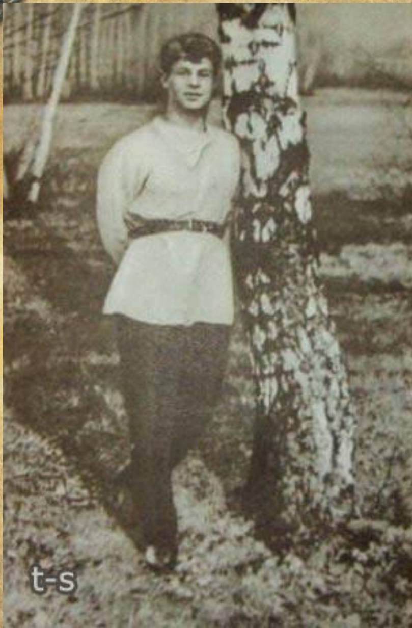
Сергей Есенин у березы. Фото - 1918 год.

В начале 1918 Есенин переезжает в Москву. С воодушевлением встретив революцию, он пишет несколько небольших поэм ("Иорданская голубица", "Инония", "Небесный барабанщик", все 1918, и др.), проникнутых радостным предчувствием "преображения" жизни. Богоборческие настроения сочетаются в них с библейской образностью для обозначения масштаба и значимости происходящих событий. Есенин воспевая новую действительность и ее героев пытался соответствовать времени ("Кантата", 1919). В более поздние годы им были написаны "Песнь о великом походе", 1924, "Капитан земли", 1925, и др.). Размышляя, "куда несет нас рок событий", поэт обращается к истории (драматическая поэма "Пугачев", 1921).