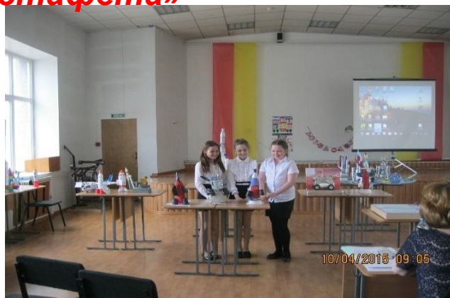
Защита проекта «Звездная эстафета»