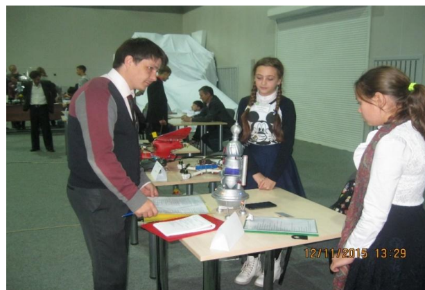
Участницы краевого конкурса «НТТМ Забайкальского края»