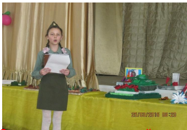
Защита проекта в районном конкурсе ко Дню Победы