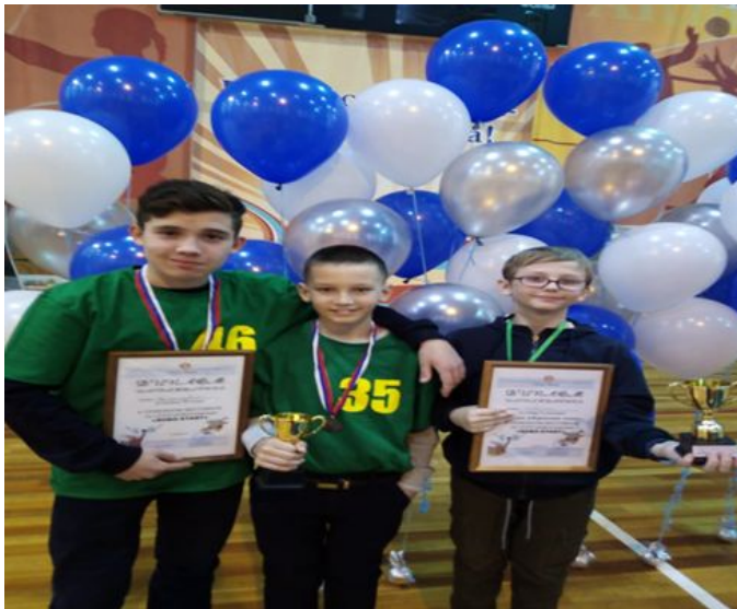
Призёры межрайонного семейного фестиваля по робототехнике