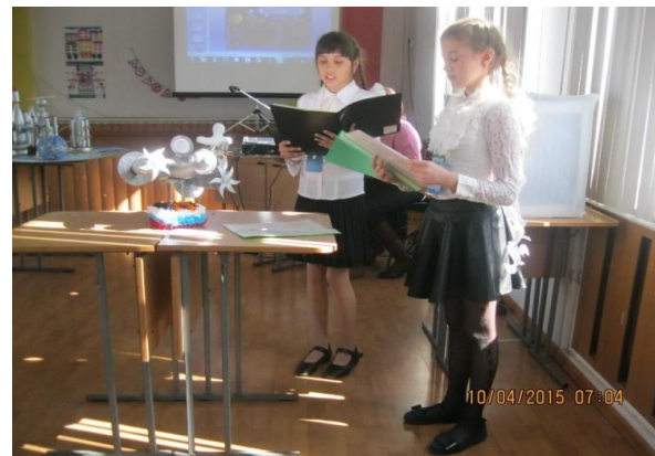
Участницы краевого конкурса «Звёздная эстафета»