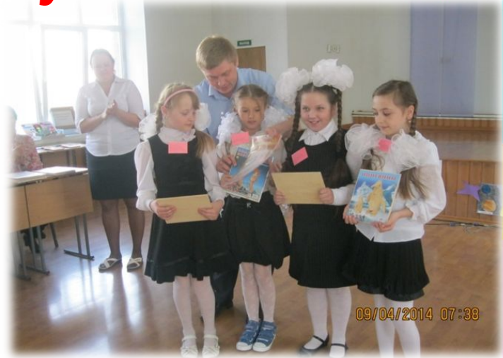
Призёры конкурса «Звёздная эстафета»