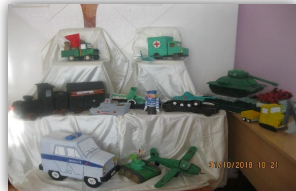
Выставка военной техники