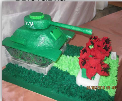
Районная выставка к Дню Победы