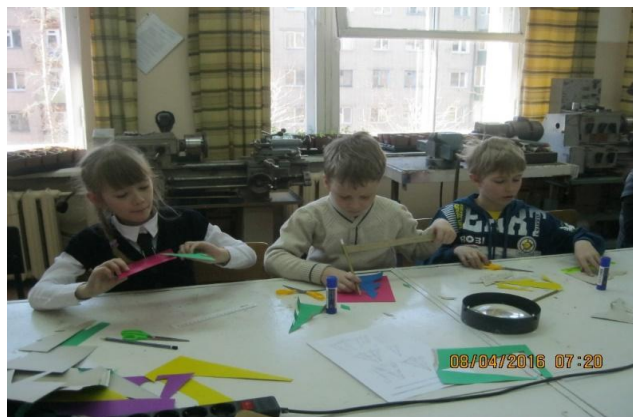
Практическая работа на конкурсе «Звездная эстафета»