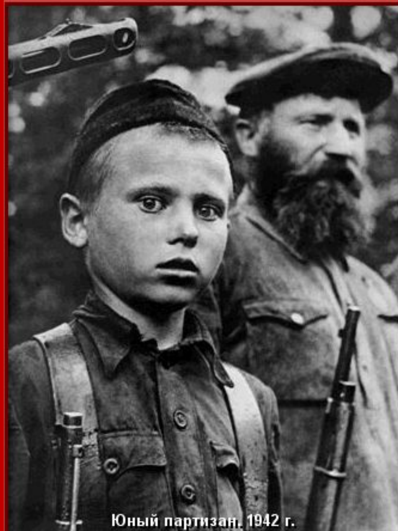
Юный партизан, 1942 г.

В серьезной степени героизм солдат и командиров сорвал планы немецкого наступления. Уже летом 41-го года были полностью сорваны планы наступления немецкой армии. Потом были Сталинград, Курск, Московская битва, но все они стали возможны благодаря беспримерному мужеству простых советских солдат и партизан, которые ценой собственной жизни останавливали немецких захватчиков.