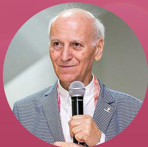
Методика гуманной педагогике Шалвы Амонашвили