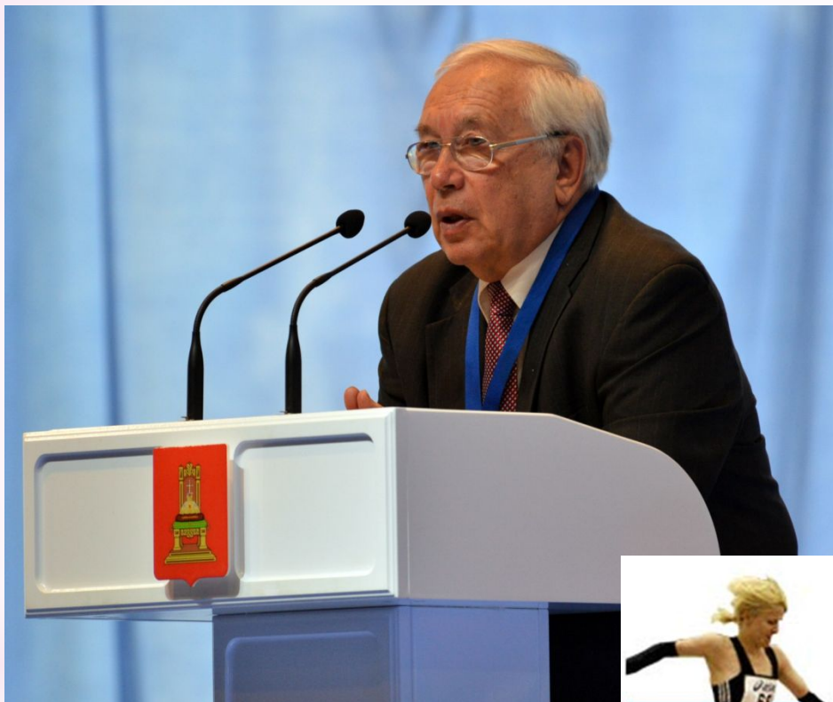
Депутат Государственной Думы В.П. Лукин.