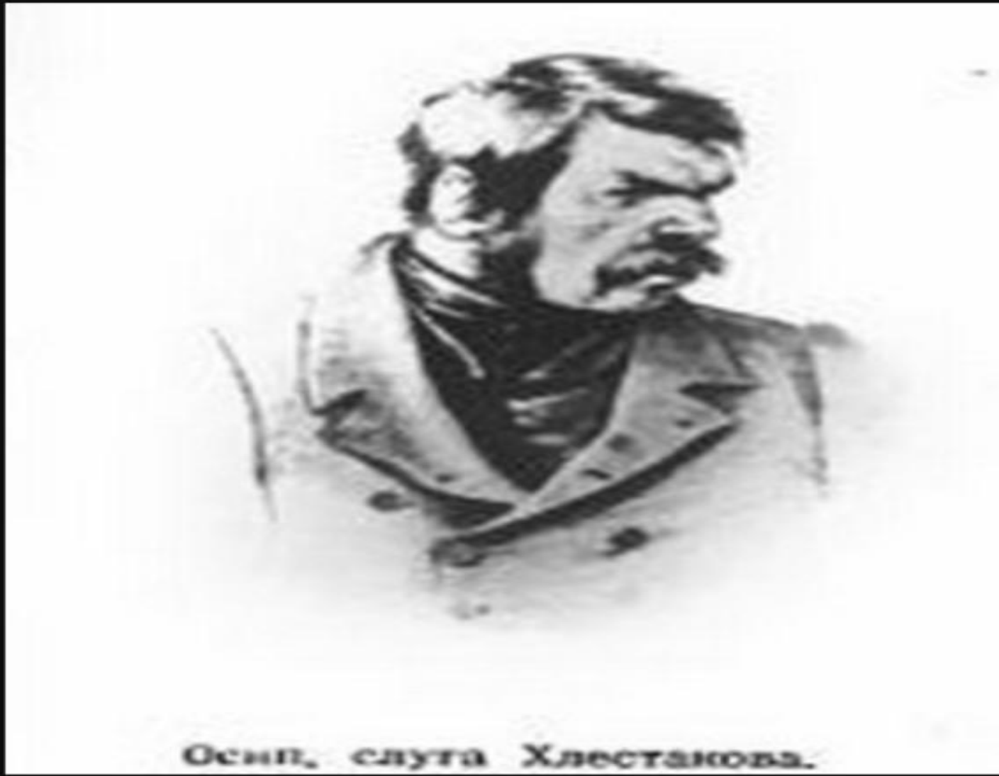
Осип, слуга Хлестакова.