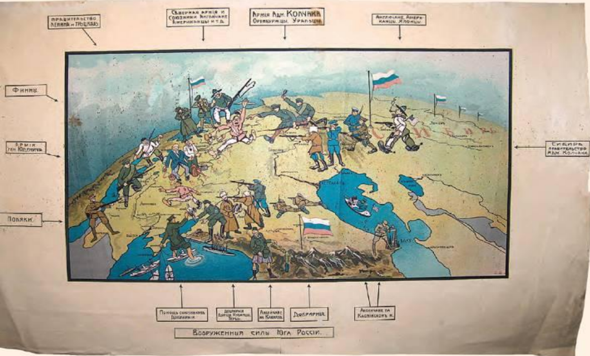
Белогвардейский плакат, изображающий состав антибольшевистских сил. 1919 г.