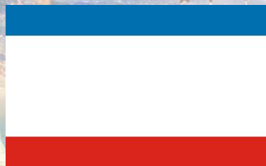
Государственный флаг Республики Крым