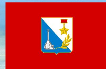
Государственный флаг города Севастополя