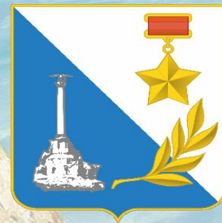
Государственный герб города Севастополя