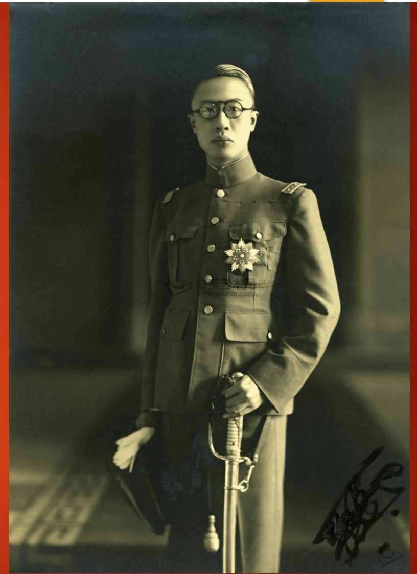
Император Пу И

В 1931 г. получила развод наложница последнего китайского императора Пу И по имени Вэнь Сю, указавшая в исковом заявлении на «плохое обращение с женой». В окружении последнего императора сохранялись старые взгляды на брак и семью, хотя после отречения Пу И от престола прошло 20 лет. Даже брат Вэнь Сю осудил ее поступок и обвинил в неблагодарности по отношению к императорскому двору.