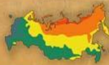
СТЕПЕНЬ БЛАГОПРИ- ЯТНОСТИ ПРИРОДНЫХ УСЛОВИЙ ЖИЗНИ НАСЕЛЕНИЯ