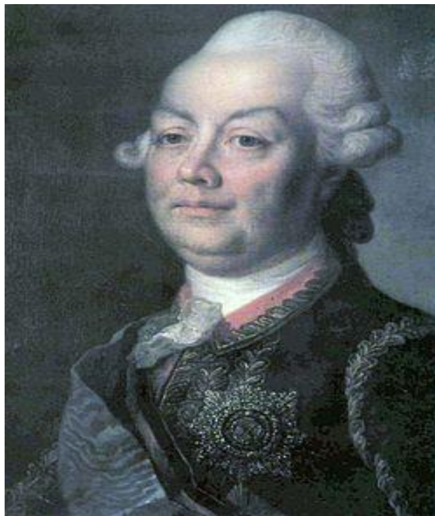
Петр Александрович Румянцев - Задунайский