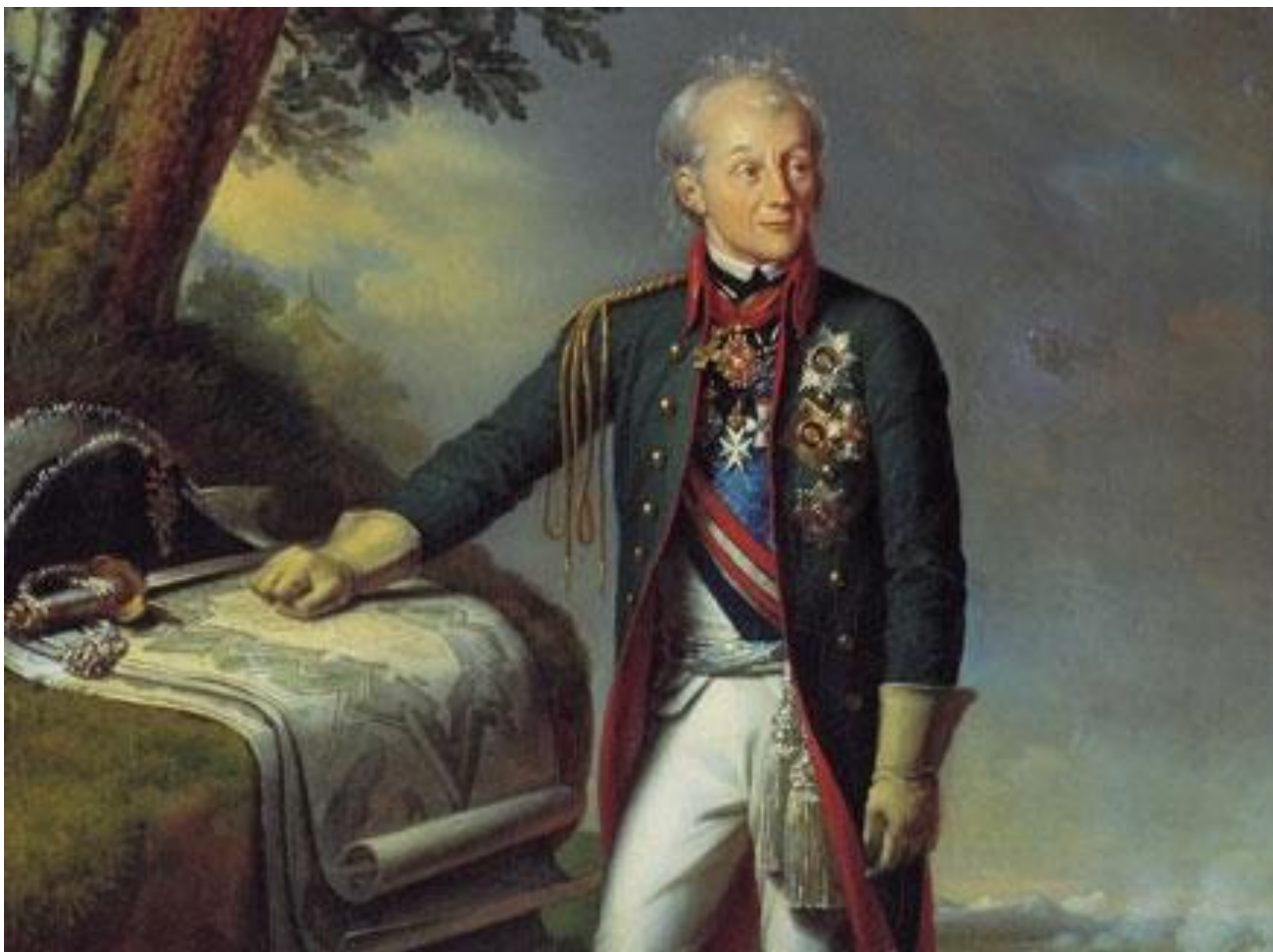
Александр Васильевич Суворов