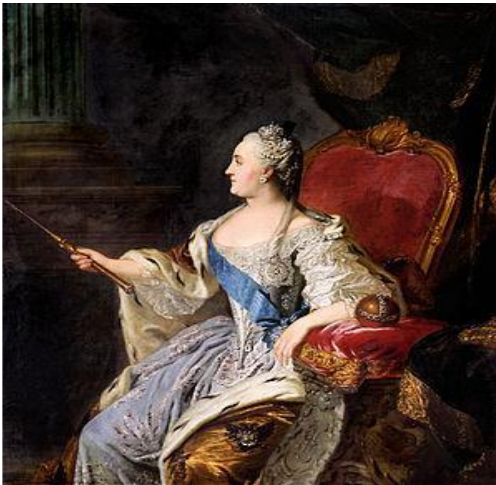
8-я Императрица Всероссийская 28 июня (9 июля) 1762 — 6 (17 ноября) 1796