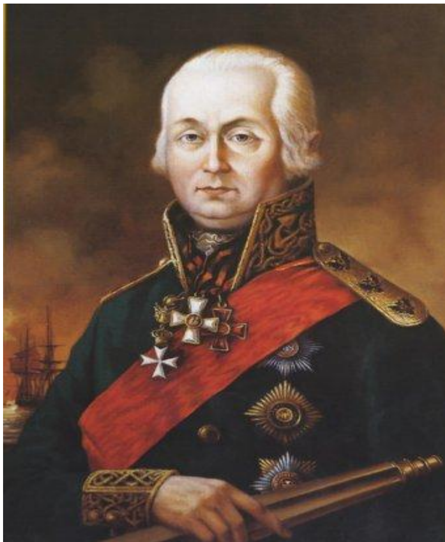
Федор Федорович Ушаков