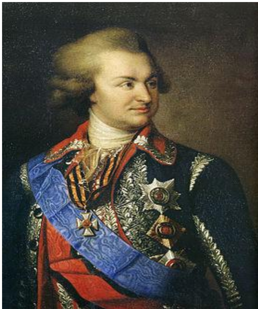
Григорий Александрович Потемкин - Таврический