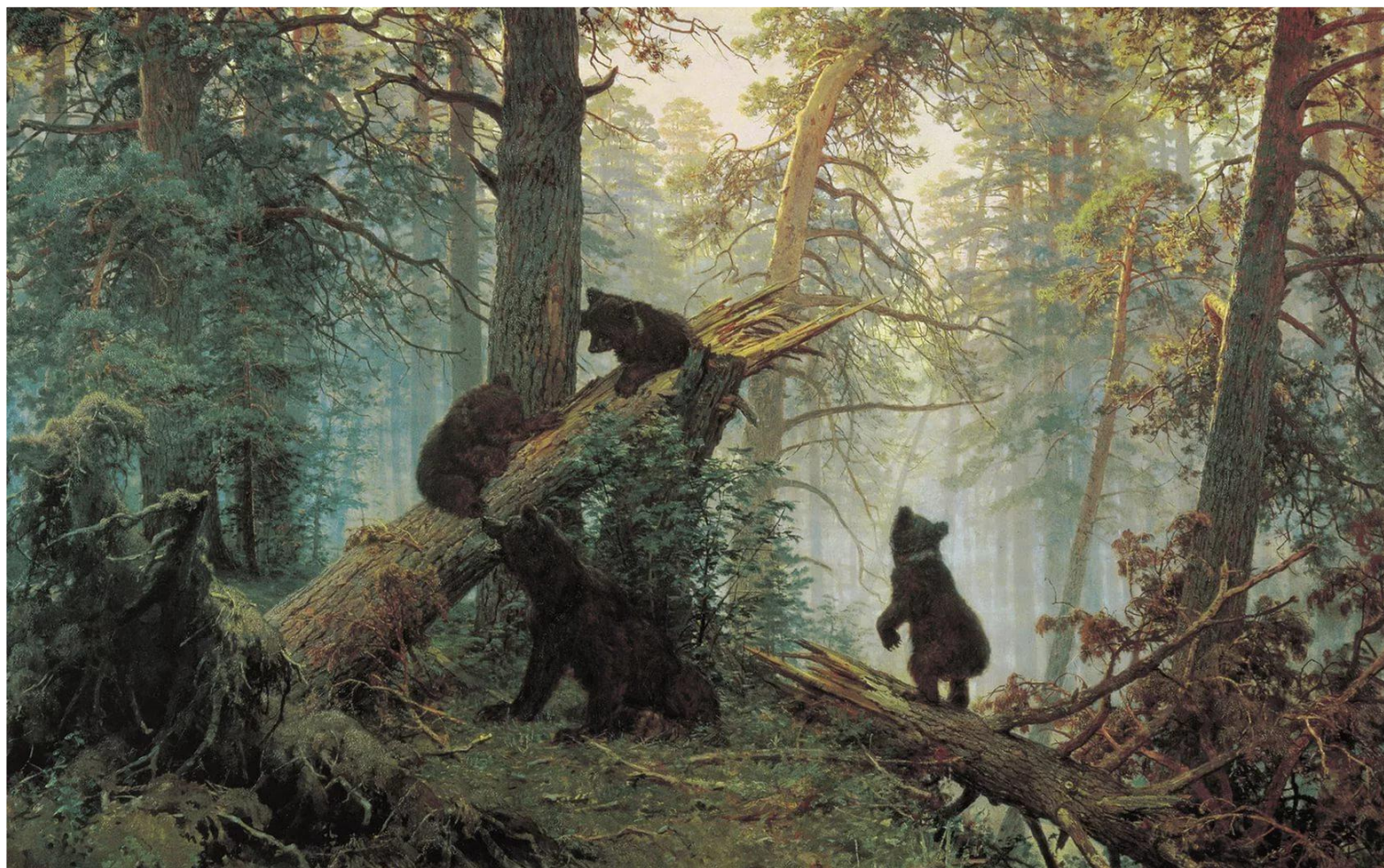
И. И. Шишкин «Утро в сосновом лесу»