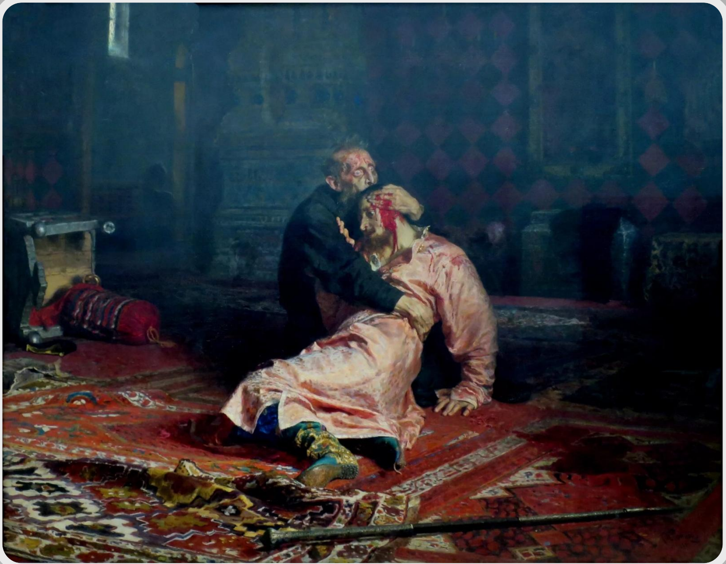
И. Е. Репин «Иван Грозный и сын его Иван»