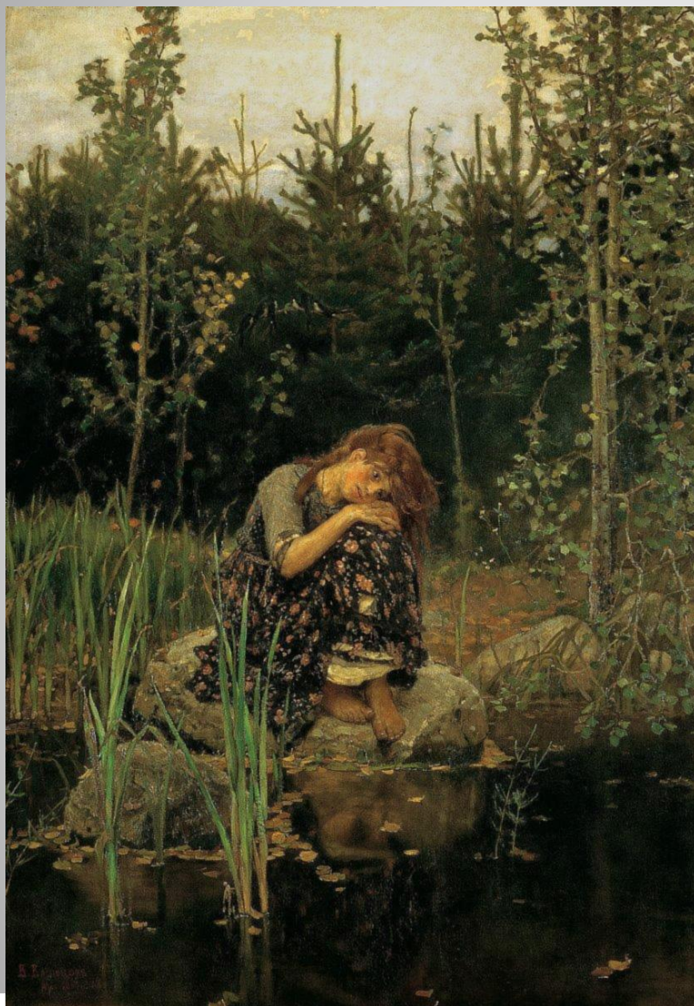
В. М. Васнецов «Алёнушка»