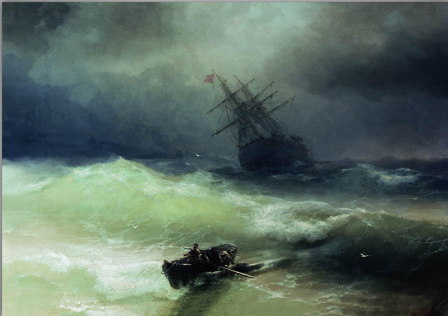
Айвазовский Иван Константинович «Буря»