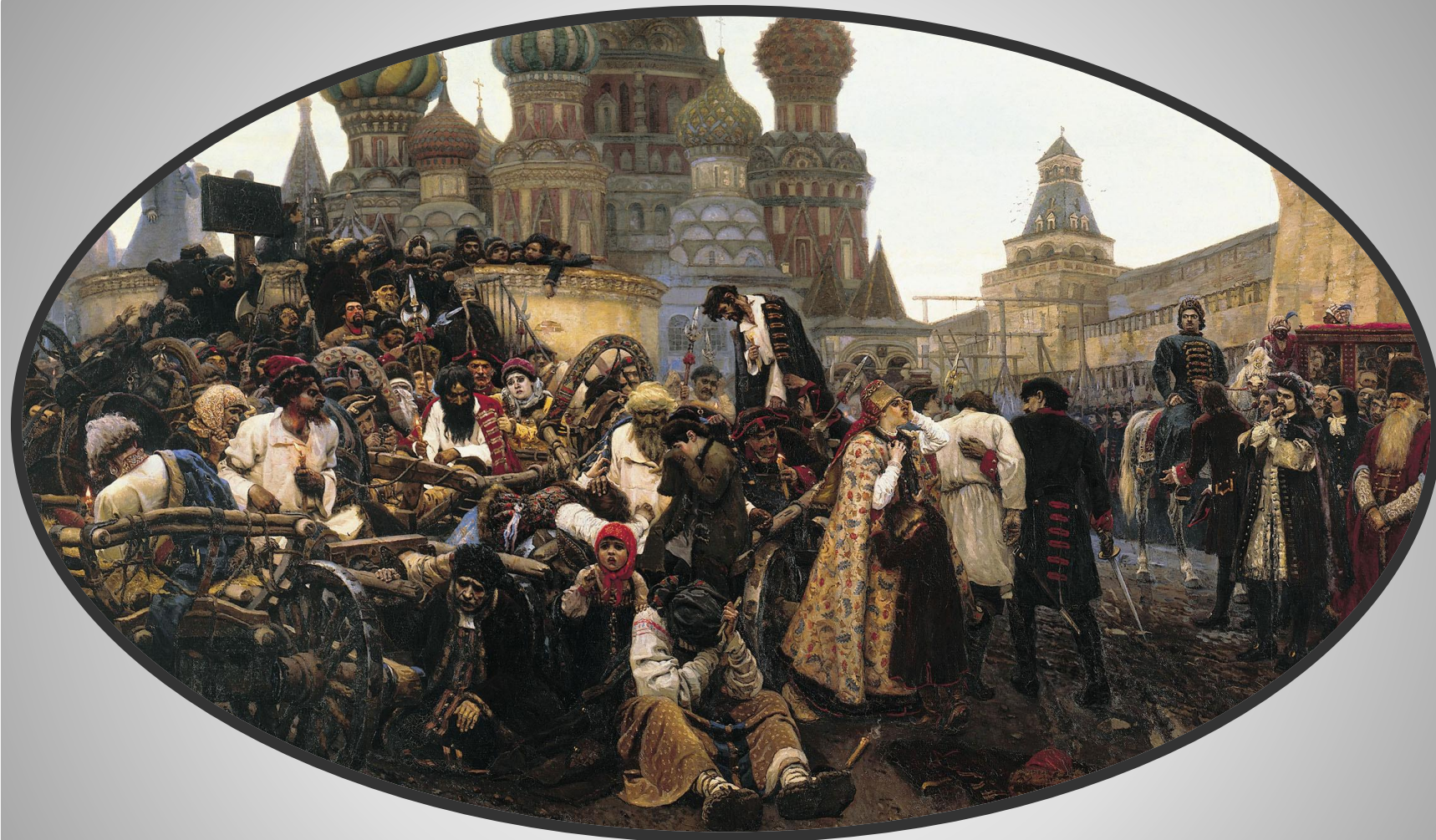
В. И. Суриков «Утро стрелецкой казни»