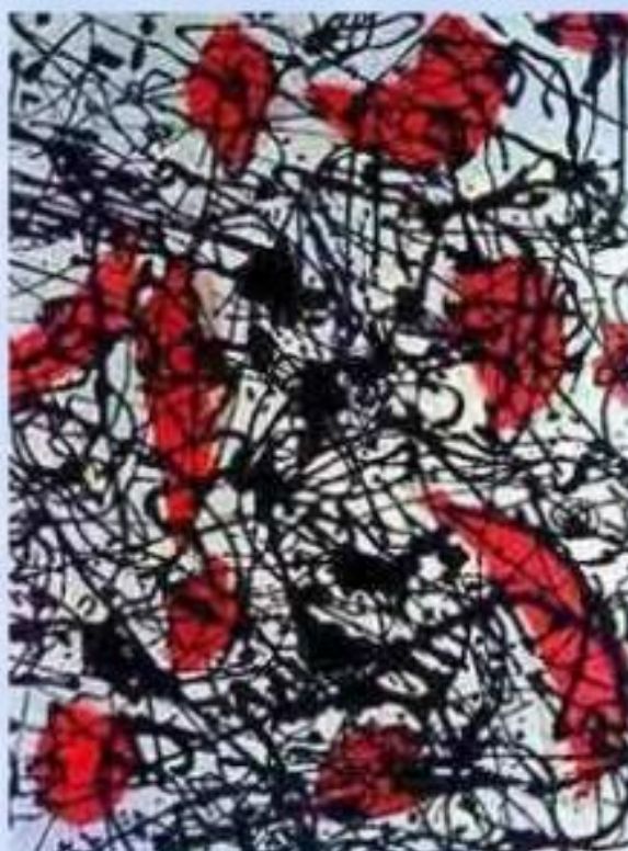
Дж. Поллок «№ 15»