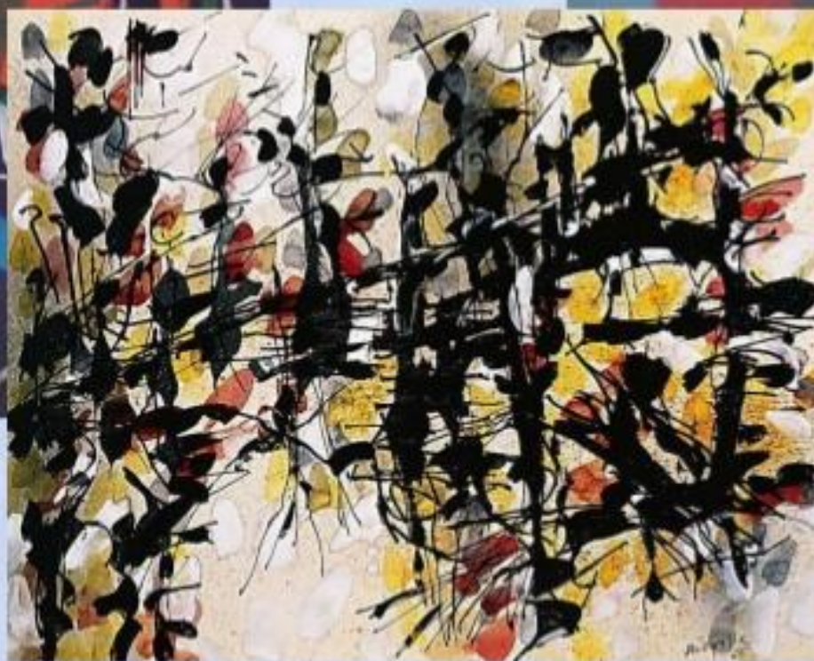
Жан-Поль Риопель «Без названия»