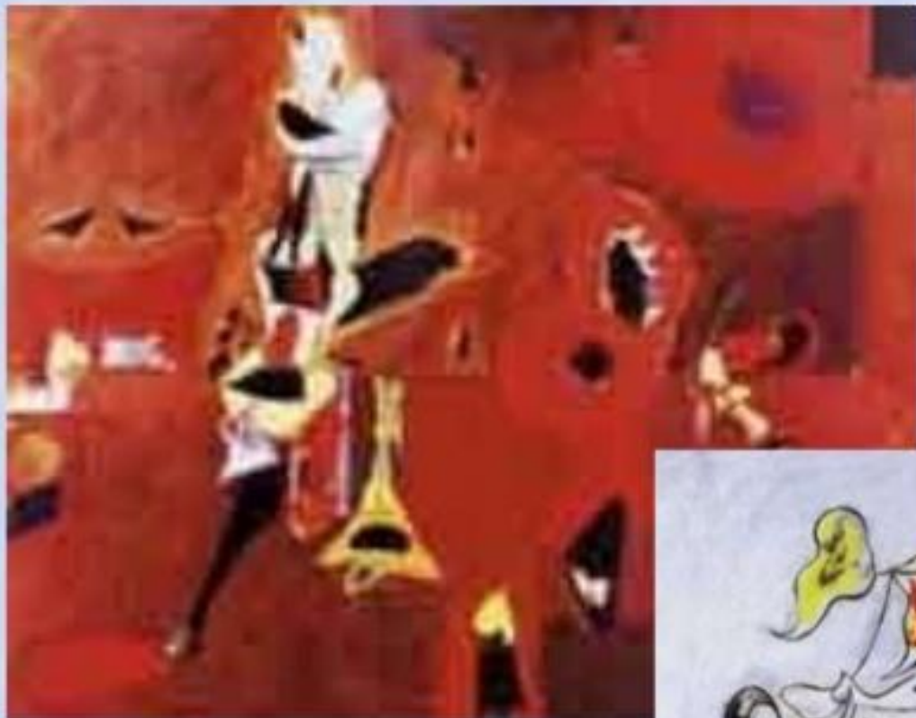
Арчи Горки «Композиция в красном»