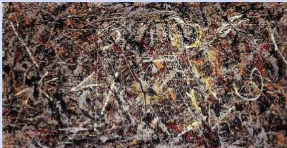
Дж. Поллок «Алхимия»