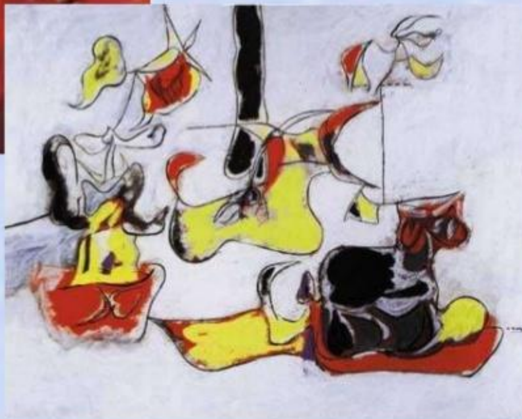
Арчи Горки «Сад в Сочи»