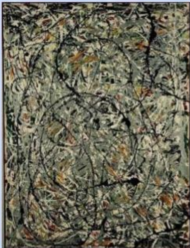
Дж. Поллок «Волнистые линии»