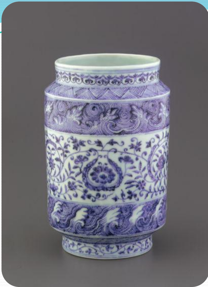
Китайська порцелянова ваза періоду Династії Мін.