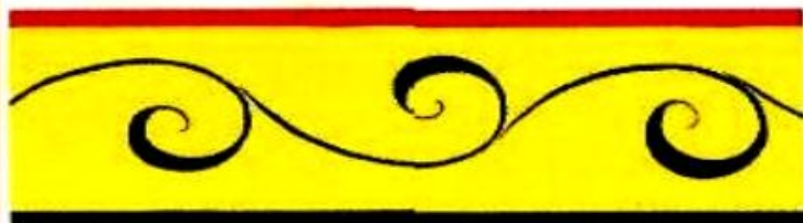
воздушный стебель — «парусик»