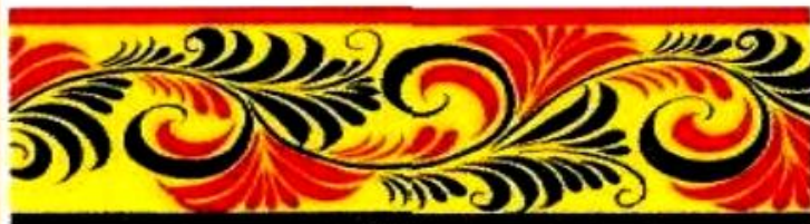
заполнение цветом и контурными листьями