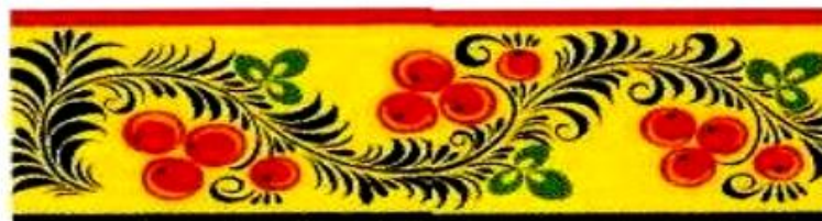
заполнение цветом и контурными листьями