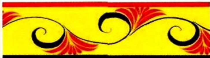
«парусик» с контурными листьями