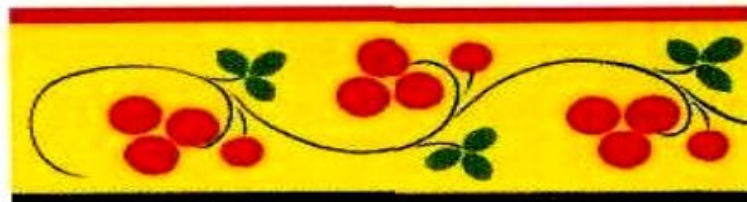
воздушный стебель — «крупяк»