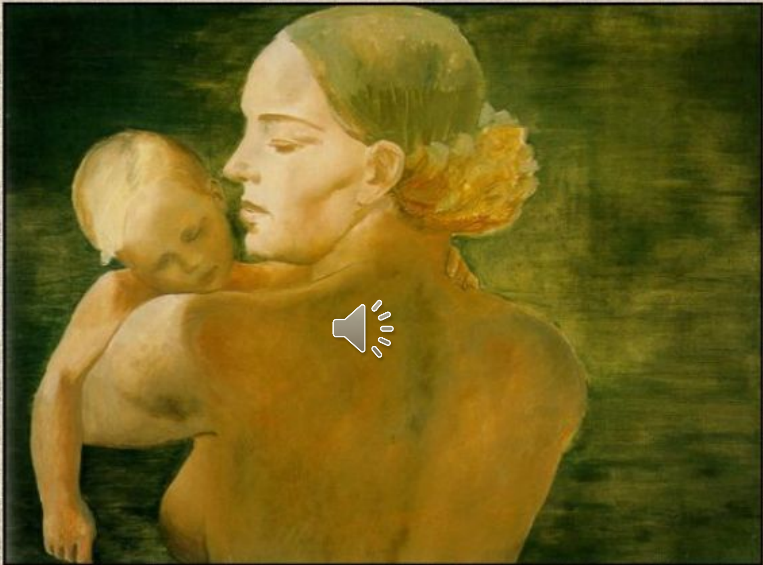
А. Дейнека «Мать»