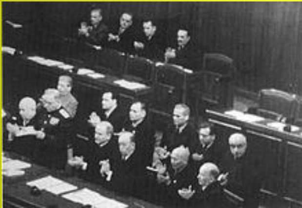
Президія XIX з'їзду КПРС