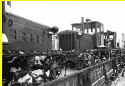
Трактори, випущені на ХТЗ для освоєння цілих земель