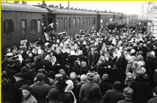
Проводи молоді Херсонщини на цілинні землі