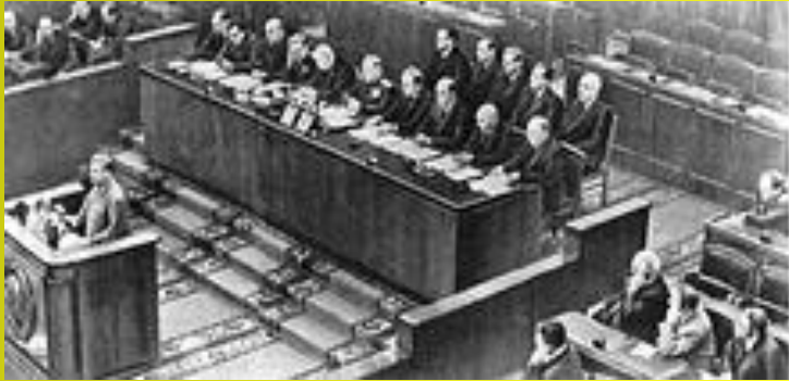
Виступ Й.В.Сталіна на XIX з'їзді КПРС