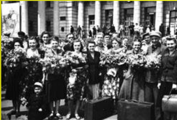
Перед відправленням на цілинні землі. Львів.

22 лютого 1954 р. на цілину було відправлено першу групу українських механізаторів. Загалом за 1954-1956 рр. на постійну роботу в цілинні райони виїхало 80 тис. осіб. А до 1961 р. туди передали 90 тис. тракторів і сільгоспмашин, виготовлених на українських підприємствах.