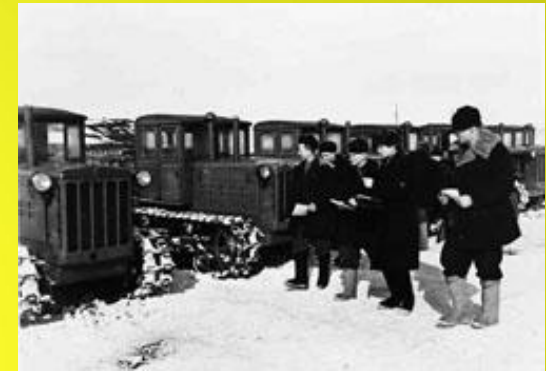
Члени комсомольсько-молодіжної тракторної бригади