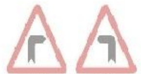
1.1 Небезпечний поворот праворуч 1.2 Небезпечний поворот ліворуч