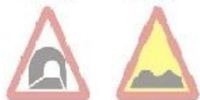
1.9 Тунель 1.10 Нерівне дорожжя