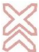
1.30 Багатокопійна загізниця