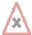
1.21 Перехрещення рівнозначних дог