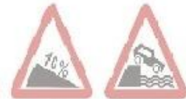
1.7 Крутий спуск 1.8 Еїзд на набережну або берег