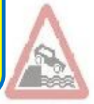
1.8 Емізд на набережну або берег