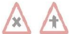
1.21 Перехрещення різномісних дозів 1.22 Перехрещення з другорядною дорогою