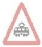
1.20 Перехрещення з трамвайною колією