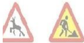
1.36 Діє тварини 1.37 Дорожні роботи