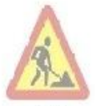
1.37 Дорожні роботи