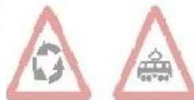
1.19 Ізехрещення з рухом по колу 1.20 Перехрещення з трамвайною колеєю