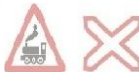
1.28 Залізничний переїзд без шлагбаума 1.23 Одноколійна залізниця