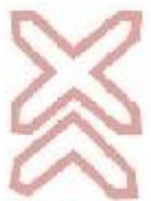
1.30 Багатокількісна залізниця