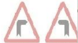
1.1 Небезпечний поворот праворуч