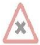
1.21 Перехрещення різноманітних дог