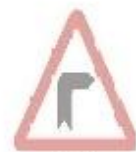
1.1 Небезпечний поворот праворуч